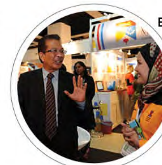
Berita: UMK jadi Universiti awam pertama menganggotai GCEE m/s: 24