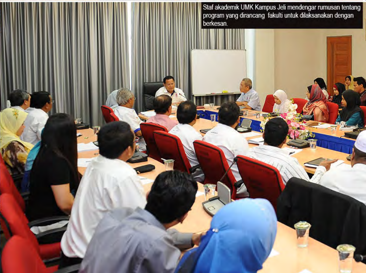
Staf akademik UMK Kampus Jeli mendengar rumusan tentang program yang dirancang fakulti untuk dilaksanakan dengan berkesan.