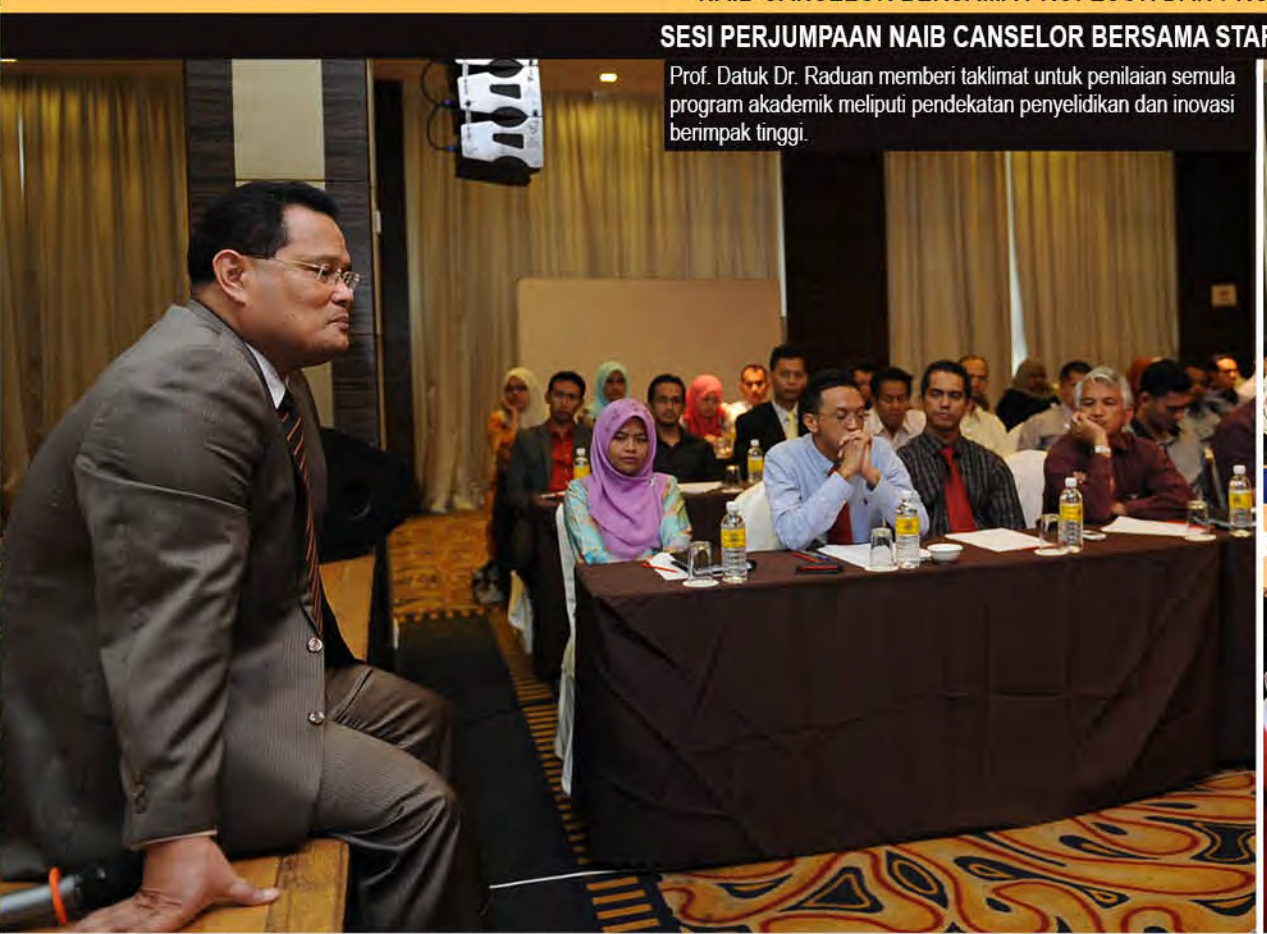
SESI PERJUMPAAN NAIB CANSELOR BERSAMA STAF AKADEMIK