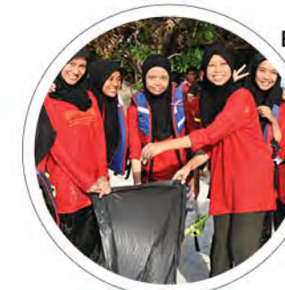
Berita Semasa: PROGRAM PENGHAYATAN TAMAN LAUT: UMK PULIHARA PULAU PERHENTIAN m/s: 10-11