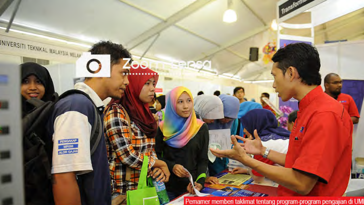
Pemamer memberi taklimat tentang program-program pengajian di UMK.