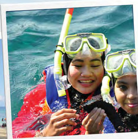
Hidupan laut yang ditemui pelajar.