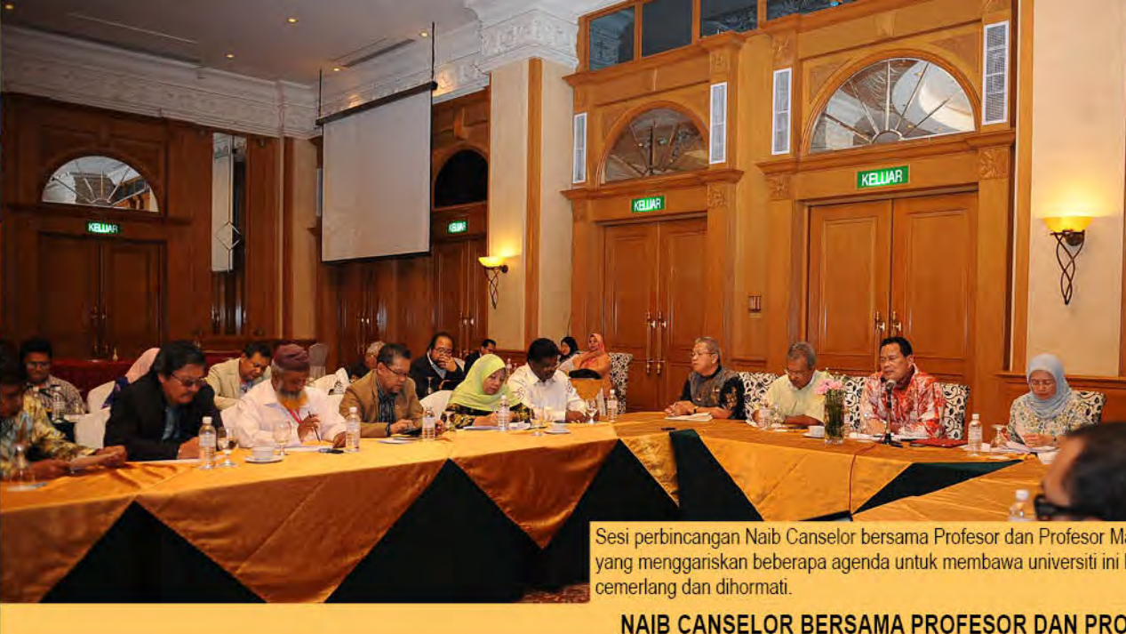
Sesi perbincangan Naib Canselor bersama Profesor dan Profesor Madya yang menggariskan beberapa agenda untuk membawa universiti ini lebih cemerlang dan dihormati.