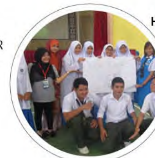
HEP: Program Khidmat Komuniti Lambaian Bumi Borneo m/s: 21