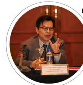
Berita Semasa: UMK AGE COUNCIL - JARINGAN KERJASAMA PINTAR UMK DAN INDUSTRI m/s: 7