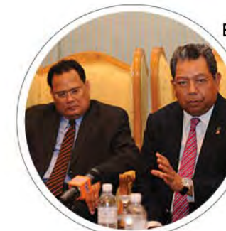
Berita Semasa: ELPIIC 2013: Usaha UMK perkenalkan Model MyRasch di kalangan penyelidik m/s: 6