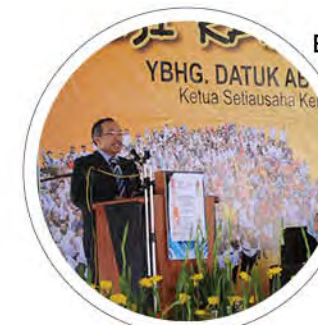
Berita Semasa: Sesi Ramah Mesra YBHG. DATUK AL. Y.B. Ketua Setiausaha Ke... m/s: 8