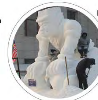
FTKW: FTKW menang tempat kedua Ice and Snow Sculpture Harbin 2013 m/s: 15