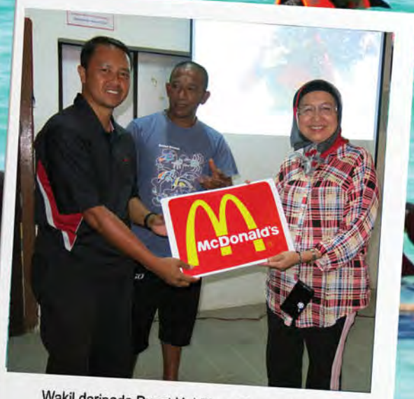
Wakil daripada Pusat Hal Ehwal Korporat menyampaikan sumbangan penaja kepada SMK DAM.