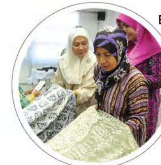
Berita Semasa: FTKW perlu komersilkan batik di pasaran antarabangsa m/s: 6