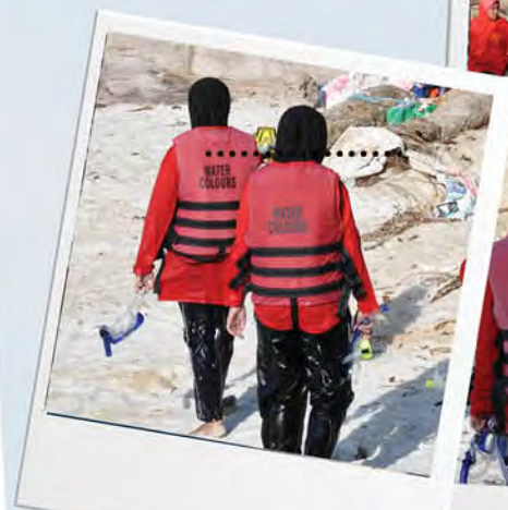
Aktiviti gotong-royong membersihkan pantai.