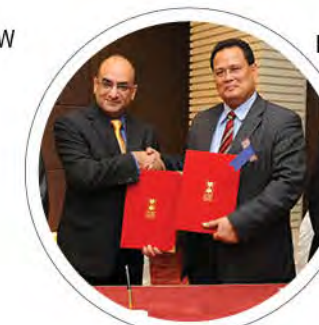
FKP: UMK JADI TUAN RUMAH BERSAMA ANJUR PERSIDANGAN IBIMA KE-2 m/s: 14