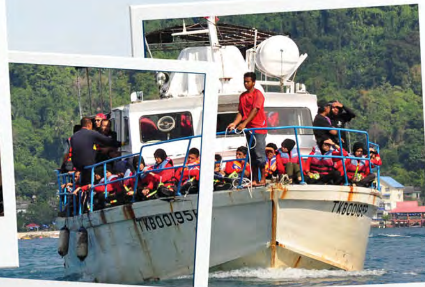
Pengalaman pertama pelajar menaiki bot.