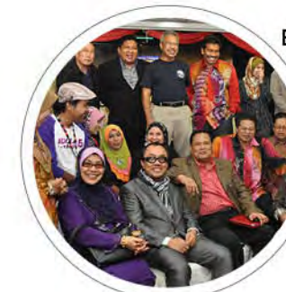
Berita Semasa: Majlis Ramah Mesra bersama Media m/s: 9