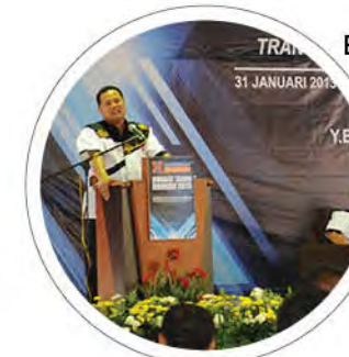
Berita Semasa: Amanat Tahun Baharu Naib Canselor 2013 m/s: 2-5