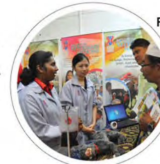
FPV: Persatuan Mahasiswa Perubatan Veterinar UMK sertai Karnival Antarabangsa BioKelantan m/s: 20