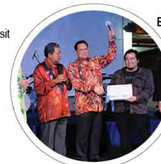
Berita: MTE 2013: UMK menang empat perak dan dua gangsa m/s: 23