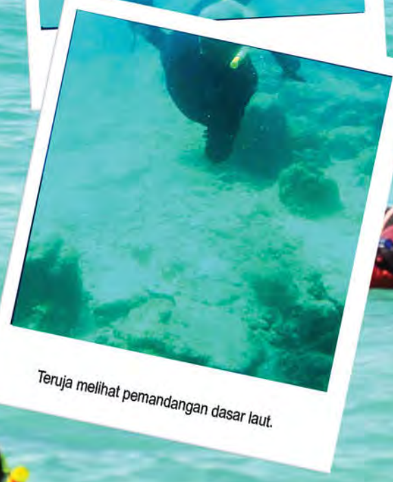
Teruja melihat pemandangan dasar laut.