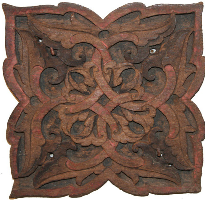
Figure 1 : Panel siling motif Langkasuka

Jika dilihat hari ini sememangnya Ukiran Kayu Melayu tidak kira tradisi ataupun kontemporari mula mendapat tempat dihati peminatnya. Nilai-nilai estetik yang ada pada ukiran kayu ini mula dinilai apabila ada badan-badan kerajaan dan NGO mengambil langkah yang sewajarnya bagi memulihara warisan tradisi kita. Bahan yang digunakan itu sendiri juga menggambarkan betapa kita kaya dengan hasil hutan. Kayu seperti Cengal, Merbau, Balau, Seraya dan lain-lain lagi merupakan produk yang berkualiti dalam penghasilan ukiran kayu. Selain daripada bahan yang bermutu, kualiti dari segi ukiran juga menjadi faktor utama. Kehalusan pahatan oleh pengukir-pengukir kita menjadikan ia menjadi lebih sempurna.