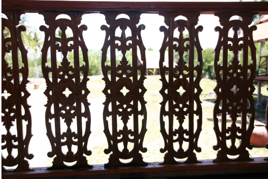
Figure 2 : Pagar Musang rumah Tradisional Terengganu

Sehingga kini masih ada rumah-rumah yang mengekalkan ukiran kayu yang bermotifkan motif tradisional dalam pembinaan sesebuah rumah. Liuk lentok sesebuah olahan pada ukiran kayu itu masih dikekalkan bagi menghidupkan suasana tradisional itu.