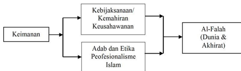
Rajah 1 : Gambaran Model Keusahawanan Islam

d) Kesemua usaha tersebut berpaksikan kepada keimanan kepada Allah dengan niat untuk mendapatkan keredhaanNya dan mencapai al-falah. Dan proses tersebut tidak akan berlaku tanpa kemahiran dan ciri tertentu yang didokong oleh nilai dan prinsip tertentu. Sekiranya semua syarat tersebut dipatuhi maka keberkatan juga akan mengiringinya. Sila lihat rajah di bawah.