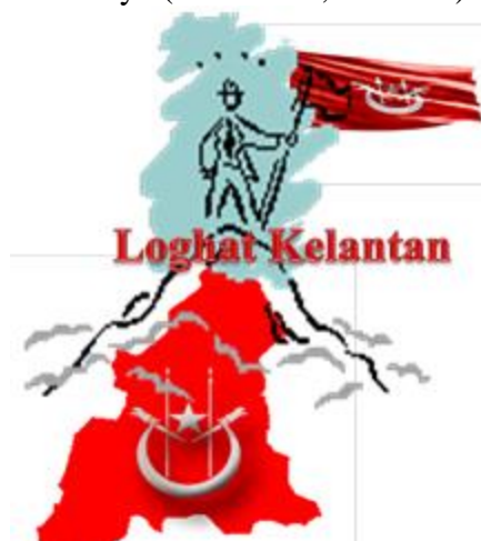
RAJAH 1: Ilustrasi jati diri Kelantan