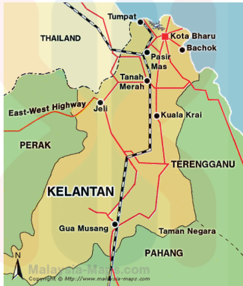
Rajah 1.1: Peta Kelantan