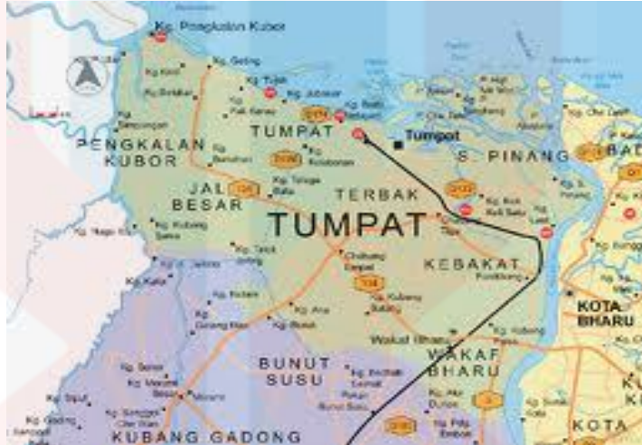
Rajah 1.2: Peta Tumpat