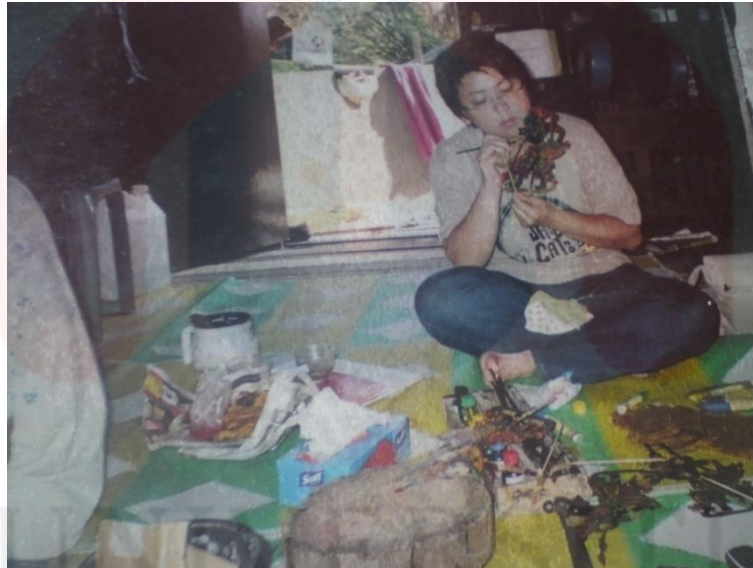
Rajah 4.3 : Pelancong dari Jepun