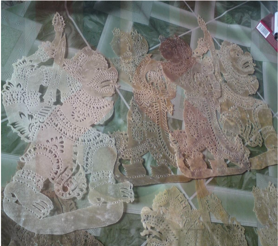
Rajah 4.5: Contoh patung wayang kulit yang dibuat oleh Pak Usop