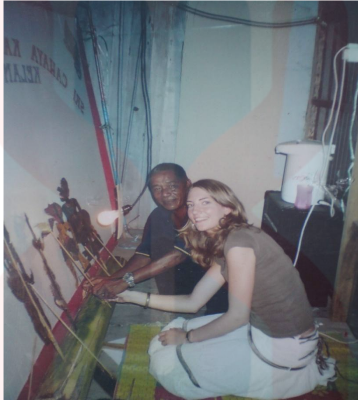
Rajah 4.4: Pelancong dari Russia