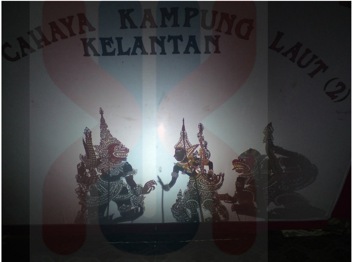
Rajah 4.2: Kumpulan Cahaya Kampung Laut (2)