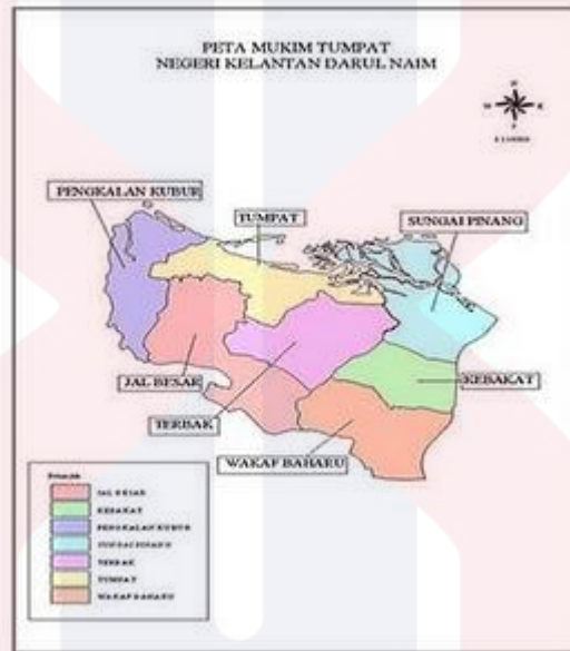
Peta 2.1 Daerah Tumpat