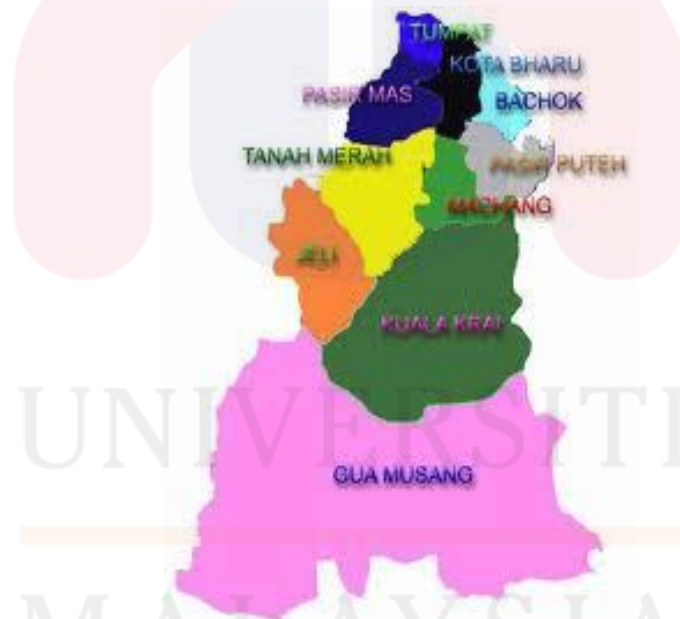
Peta 1.1 Negeri Kelantan Darul Naim

sumber pendapatan dalam isi keluarga. Ada juga menjadikan perikanan sebagai sumber pendapatan. Hal ini demikian kerana, kawasan Tumpat adalah berhampiran dengan kawasan perairan seperti pantai dan sungai.