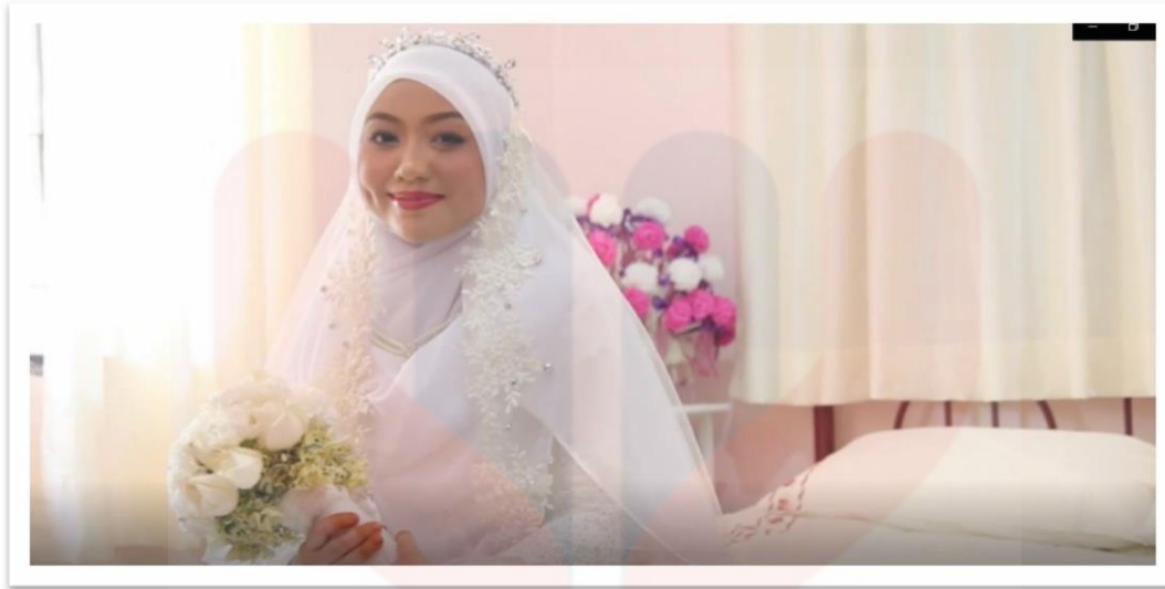
Rajah 4.4 : Teknik Pencahayaan 3

Pada durasi 0:06:35 sehingga 0:06:40 menunjukkan penggunaan ( soft light ) dan ( nature light ). Kedua-dua teknik ini digabungkan yang menerangkan seorang pengantin perempuan yang sedang duduk diatas katil ditepi tingkap. . Tahap cahaya tidak mempengaruhi warna, tetapi hanya kecerahan persekitaran dan spektral keluk pengagihan kuasa cahaya lembut dan terang (Onder Barli, 2011). Babak ini memberikan adengan yang akan terasa emosional, serta memiliki sinematografi cahaya yang lembut. Sumber cahaya yang lembut ini membuatkan penonoton lebih tenang dan tertarik untuk melihatnya. Cahaya ini merupakan cahaya yang sudah tersedia ada. Pencahayaan tidak hanya dibuat emosi, kesedihan atau kejutan, tetapi juga boleh mewujudkan penonton berasa gembira apabila melihat seorang perempuan yang berpakaian cantik dan wajah yang berseri (Smith, 2006). Situasi ini menunjukan penonton lebih memahami apa yang disampaikan dalam video tersebut. Untuk menerangkan bahawa cahaya itu lembut, dan dengan demikian juga benda-benda yang diterangi dengan cahaya lembut, mungkin hanya menunjukkan jangkaan bahawa kemungkinan sesuatu yang paling hampir dengan objek-objek itu dihasilkan sebagai lembut juga (Torben, 2005).