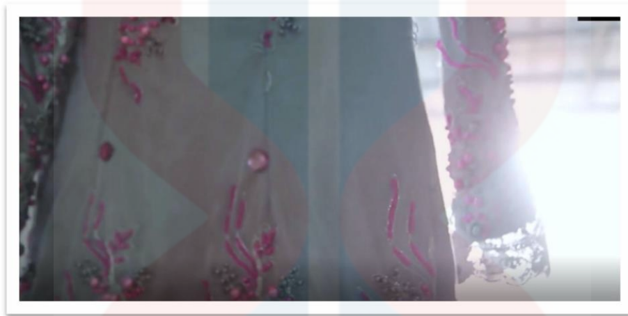
Rajah 4.1 : Teknik Pencahayaan 1

Hasil analisis light and colour dalam penghasilan sinematik video perkahwinan Athirah,2015 menunjukkan bahawa pada durasi 0:00:21 sehingga 0:00:26 terdapat penggunaan unsur denotatif melalui pencahayaan semulajadi ( nature light ). Melalui teknik pencahayaan dalam video ini, membawa makna keadaan cuaca pagi atau matahari terbit ketika baju ini digantung dalam bilik. Juruvideo mengambil teknik yang mereka hasilkan, yang paling penting adalah pencahayaan dramatik dan sudut psikologi subjektif, ekspresi menerangkan kisah dan gaya adengan kammerspielfilm ( Smith, 2006). Pencahayaan yang digunakan seimbang mengikut gerakan kamera dan kedudukan objek dan cahaya. Disitu juga kelihatan, cahaya dari luar yang terang.