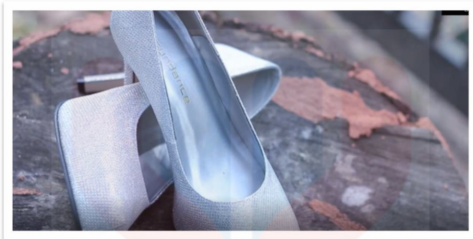
Rajah 4.2 : Teknik Pencahayaan 2

Selain itu, dalam teknik pencahayaan video perkahwinan Athirah, 2015 pada durasi 0:00:30 sehingga 0:00:32 kelihatan kasut yang diterangi cahaya. Cahaya tersebut merupakan cahaya semulajadi iaitu ( nature light ). Pemandangan yang diterangi dengan sempurna, bukan hanya menyampaikan watak-watak atau objek yang diolahkan dalam video, tetapi juga memaksa penonton untuk merasakan emosi tertentu (Smith, 20016). Hal ini kerana dengan penggunaan arah pencahayaan yang betul tumpuan dalam sesebuah scene itu dapat menimbulkan kesan kesan yang tersendiri yang dapat menaikkan emosi penonton. Selain itu juga sifat pencahayaan juga memainkan peranan penting dalam mewujudkan sebuah ruang dimensi yang berbeza (Hisham, 2004). Teknik pencahayaan ( nature light ) dalam video ini membawa maksud ketika kasut itu diletakkan diatas sebuah bongkah, ia menunjukkan dibawah cahaya matahari waktu jam 9 pagi hingga 10 pagi. Cahaya ini merupakan cahaya yang sudah tersedia ada dan tidak menggunakan pencahayaan lain.