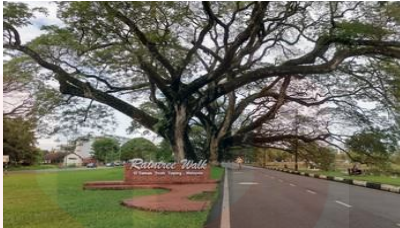
Gambar 4.6: Persekitaran Raintree Walk