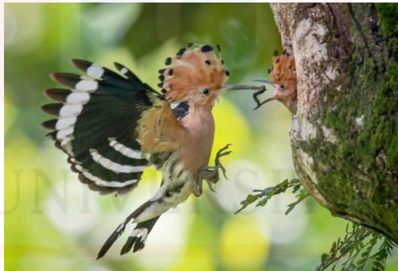
Gambar 4.3: Pasangan burung jantan dan betina spesies itu mula dikesan membuat sarang di Pokok Jemerlang

semulajadi ini wajar diiktiraf sebagai tapak warisan semulajadi di Malaysia dan dunia, seramai 233 orang responden (94%) memilih jawapan ya, manakala jawapan tidak seramai 15 orang responden (6%). Soalan kedua dalam bahagian ini menyatakan pada tahun 2021, burung Hud-Hud memilih Taman Tasik Taiping sebagai destinasi persinggahan dalam proses pembiakan burung tersebut, ia menjadikan kawasan taman tasik ini merupakan alam semulajadi yang sesuai sebagai persinggahan haiwan yang unik kerana persekitaran yang segar dan tenang, majoriti responden iaitu sebanyak 212 orang (85.5%) menyatakan ya dan seramai 36 orang responden (14%) menyatakan tidak berkenaan persinggahan burung hud-hud ini.