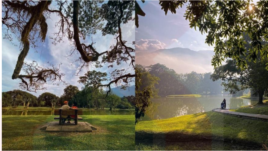
Gambar 4.1: Suasana Hijau Dan Tenang Di Persekitaran Taman Tasik Taiping.

mengetengahkan kawasan hijau, lapang berkontur dan pokok-pokok besar, ia juga dikatakan menyamai Kensington Park iaitu taman awam yang tercantik di London pemilihan jawapan ya seramai 221 orang responden (89.8%), berbanding pemilihan jawapan tidak sebanyak 25 orang responden (16.2%).