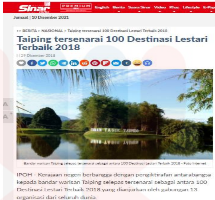
Gambar 4.2: Keratan Akhbar Pengiktirafan Taman Tasik Taiping, Perak