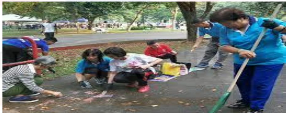
Gambar 4.7: Aktiviti Gotong Royong

Soalan ketiga ialah kebersihan dan keselamatan di tapak warisan ini merupakan tanggungjawab komuniti setempat ia dapat mewujudkan psikologi yang positif terhadap komuniti sekitar menunjukkan seramai 184 orang responden (74.2%) memilih sangat setuju, seramai 49 orang responden (19.8%) memilih setuju, pemilihan agak setuju mendapat seramai 11 orang responden (4.4%), manakala untuk tidak setuju dan sangat tidak setuju masing-masing sebanyak 2 orang responden (0.8%).