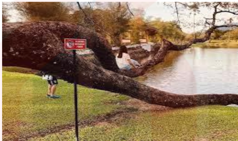
Gambar 4.8: Diatas Adalah Contoh Isu Vandalisme Yang Merosakkan Pokok Dikawasan Taman Tasik

kepada pihak atasan. Hal ini supaya taman tasik tidak dicemari dengan kerosakan dan contengan yang memburukan imej Taman Tasik Taiping. Hasil analisis ini mendapati seramai 174 orang responden (70.2%) memilih sangat setuju, pemilihan setuju mendapat seramai 54 orang responden (21.9%), agak setuju sebanyak 14 orang responden (5.6%), tidak setuju seramai 4 orang responden (1.6%) dan seramai 2 orang responden (0.8%) memilih sangat tidak setuju.