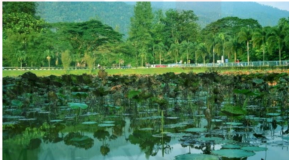
Gambar 4.4: Spesies Tumbuh-Tumbuhan Di Sekitar Kawasan Taman Tasik

Soalan ketiga ialah Taman Tasik Taiping ini memberi manfaat terhadap ekosistem dan ekologi di kawasan sekitar yang menentengahkan kehidupan hijau atau alam semulajadi, seramai 233 orang responden (94%) menyatakan ya dan seramai 15 orang responden menyatakan tidak. Perkara keempat dalam bahagian ini terdapat seramai 226 orang responden (91.1%) memilih ya dan 15 orang responden (6%) menyatakan tidak bagi soalan taman tasik ini terdiri terdapat 2,500 jenis batang pokok yang terdiri daripada 75 spesies eksotik seperti teratai putih, pokok seroja, pokok tembusu, pokok hujan-hujan, pokok brazil nut , Jacaranda Filicifolia dan pelbagai jenis spesies tanaman tempatan. Kepelbagaiaan tanaman hijau ini menjadikan taman tasik ini unik dengan menentengahkan elemen tapak warisan alam semulajadi yang mampu bertahan sehingga harini.