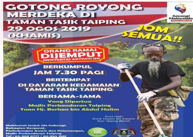
Gambar 4.9: Poster Aktiviti Gotong Royong Merdeka Di Taman Tasik Taiping

orang responden (72.6%), kedua ialah 50 orang responden (20.2%) memilih setuju, pemilihan setuju sebanyak 8 orang responden (3.2%), manakala pemilihan tidak setuju dan sangat tidak setuju ini masing-masing seramai 5 orang responden (2%).