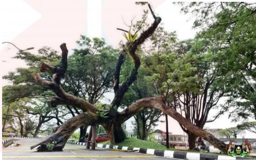
Gambar 4.5: Pokok Hujan-Hujan Melebihi Usia 130 Tahun.

Perkara kelima ialah berkenaan soalan pokok hujan-hujan atau nama saintifiknya Samanea Saman yang terdapat di taman tasik ini dapat dilihat di laluan Raintree Walk yang menjadi ikon bagi bandar Taiping kerana telah bertahan lebih dari 130 tahun ini. Hasil analisis data telah mendapat sebanyak 230 orang responden (92.7%) mengatakan ya, manakala seramai 18 orang responden (7.3%) menyatakan tidak.