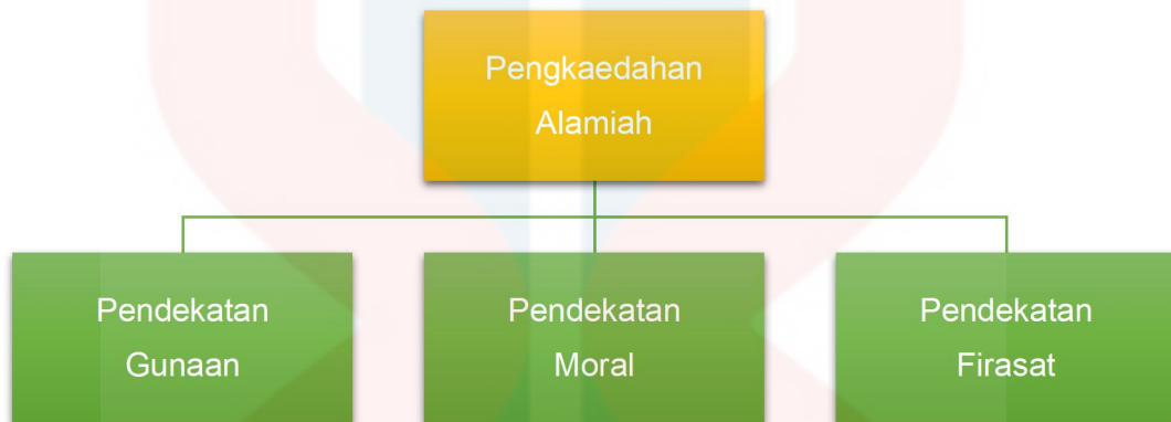
Carta 2: Jenis Pengkaedahan Alamiah

Stephen Greenblatt (1982) di mana turut melihat faktor budaya dan persekitaran dalam menghasilkan karya. Justeru, Hashim Awang membentuk teori pengkaedahan Melayu dengan mengangkat kehalusan budaya dan nilai estetika dengan mengetengahkan teks kajian serta memperincikan dengan tepat.