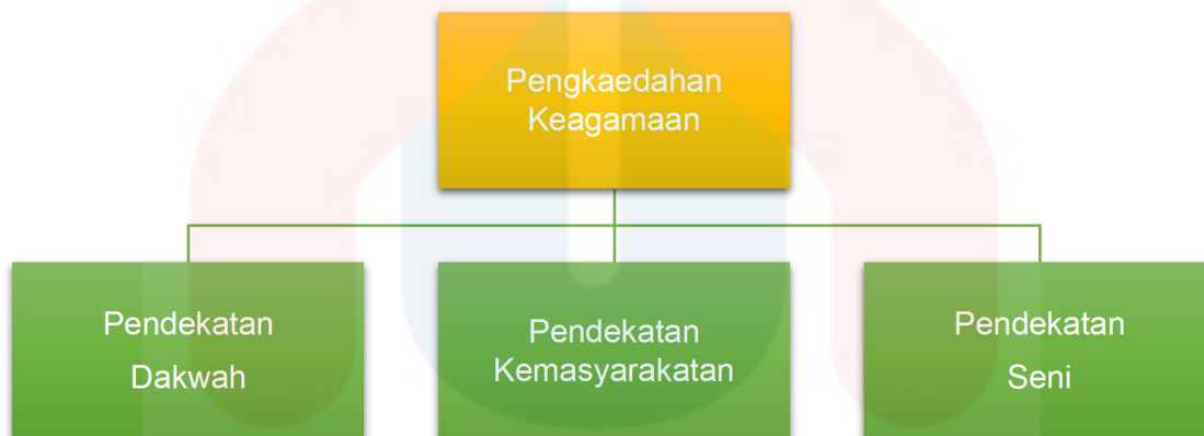
Carta 3: Jenis Pengkaedahan Keagamaan

Seterusnya, pengkaedahan keagamaan yang berteraskan ilmu agama. Rujukan utama pengkaedahan ini adalah Al Quran dan Hadis. Di samping, memperlihatkan pembentukannya yang bertujuan untuk menonjolkan sifat-sifat Allah SWT sekali gus meningkatkan ketakwaan terhadap-Nya. Tiga pendekatan tersebut menurut Hashim Awang (1994) iaitu pendekatan dakwah, pendekatan kemasyarakatan dan pendekatan seni. Dengan berbuat demikian, maka nilai dalam sastera Islam berdasarkan ketiga-tiga pendekatan tersebut dalam dilihat adalah seperti nilai estetik, moral serta sifat-sifat keagungan Allah SWT.