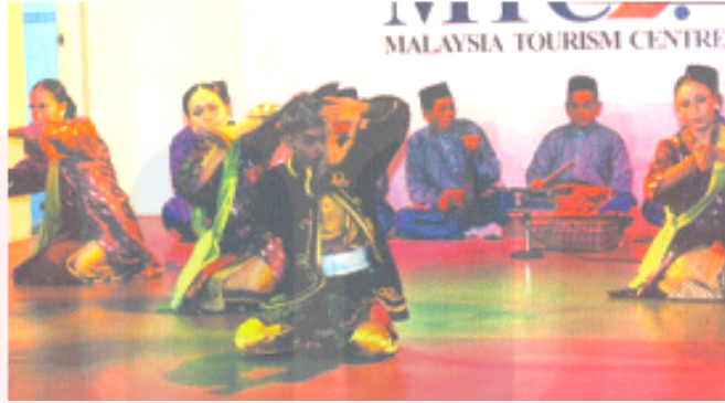
Gambar 8: Tarian Sembah