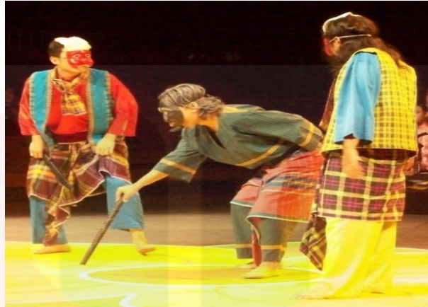
Gambar 3: Pakaian Peran