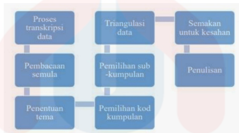
Carta Alir 2: Analisis Data

Analisis data adalah satu proses yang mana hasil dapatan kajian akan diuruskan dengan sistematik bagi mudah difahami. Penyelidik telah memilih kaedah analisis data tematik. Kaedah tematik adalah metod yang digunakan untuk menganalisis, mengidentifikasi, dan mengaitkannya dengan tema yang terdapat dalam sesuatu fenomena (Boyatzis, dalam Braun & Clarke, 2006). Selain itu, analisis data melalui kaedah tematik ini juga dapat digunakan untuk memahami sesuatu fenomena dengan lebih mendalam.