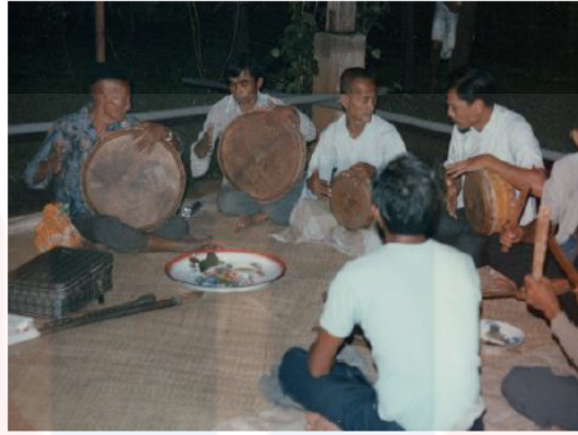
Gambar 7: Ensembel Muzik 2 (Dari Kiri: Rebana Ibu, Rebana Peningkah, Rebana Penganak, Dan Kecerek.)