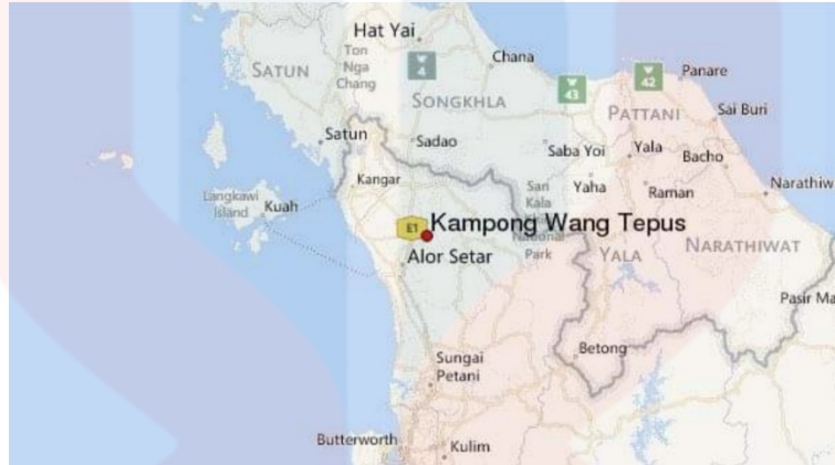
Peta 1: Lokasi Kampung Wang Tepus, Jitra, Kedah

konteks sosiobudaya yang mana pengkaji ingin lihat sejauh mana masyarakat bersatu dalam memartabatkan Mek Mulung di kampung tersebut.