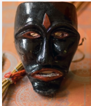
Gambar 4: Topeng Yang Dipakai Oleh Tok Wak