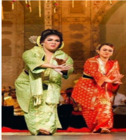
Gambar 5: Pakaian Penari Mek Mulung