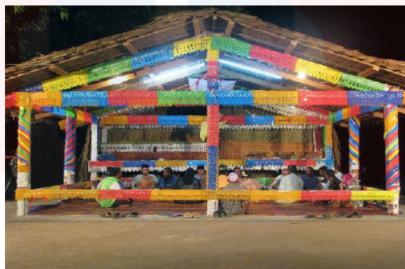
Gambar 12: Ruang Persembahan (Bangsal)

Dalam pada itu, makna sebenar persembahan Mek Mulung hanya akan difahami dan dihayati dengan baik jika ia dilakukan di tempatnya sendiri, Di tengah-tengah bangsal terdapat tiang utama atau dipanggil tiang seri. Fungsi khas tiang seri ini adalah sebagai pusat tumpuan pemain sepanjang persembahan dan dipercayai tapak yang mana pemain Mek Mulung akan merasai sesuatu semangat semasa mempersembahkan persembahan.