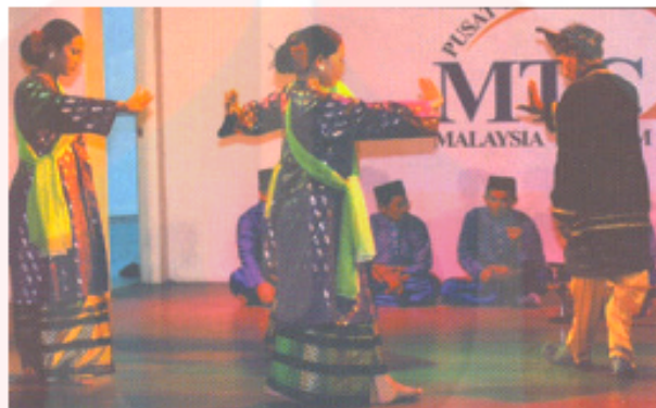
Gambar 9: Pergerakan Dalam Bentuk Bulatan