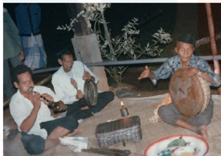
Gambar 6: Ensembel Muzik 1 (Dari Kiri: Serunai, Gong Dan Rebana Ibu)

Seterusnya, menurut Kamarudin bin Debak yang juga merupakan pemain alat muzik serunai dalam persembahan Mek Mulung, serunai dikatakan berfungsi sebagai alat pembawa melodi dan dimainkan dalam lagu instrumental pada bahagian prolog dan cerita. Penjarian dan teknik pernafasan yang betul penting dalam penggunaan serunai. Akhir sekali, menurut Mohamed Ghouse (2003), kecerek adalah pasangan buluh yang diketuk atau dipukul bersama. Bunyi dihasilkan apabila kedua-dua batang kecerek dipukul secara serentak. Kecerek berfungsi sebagai alat penanda masa sekunder dan dimainkan secara pusingan dalam jangka masa metrik yang tetap menerusi struktur kolotomik sebuah lagu.