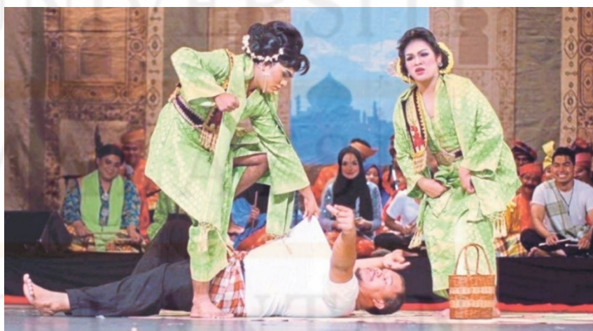
Gambar 1: Persembahan Mek Mulung