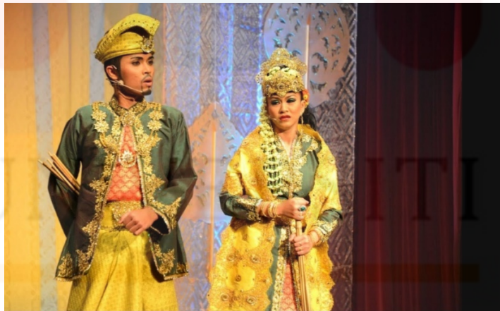
Gambar 2: Pakaian Raja Dan Puteri

Tujuan topeng-topeng ini dipakai adalah bagi membezakan peranan dan watak masing-masing. Ahli Nujum yang dikenali sebagai Tok Wak akan memakai topeng hitam dan kain biasa. Sementara itu watak inang memakai kain bersama sehelai penutup kepala. Para penari pula memakai baju kebaya labuh persis pakaian seorang wanita. Pakaian-pakaian ini melambangkan estetika dan sosiobudaya Melayu pada zaman terdahulu. Selain itu, pemakaian busana ini adalah untuk menggambarkan watak-watak yang terdapat dalam Mek Mulung. Sebagai contoh, menurut Mohd Lutfi (2012), warna kuning yang dihiasi dengan motif pada busana tersebut melambangkan sikap dan perwatakan seorang raja atau puteri. Begitu juga, penggunaan warna merah yang dipakai oleh watak jahat atau garang dalam persembahan itu.