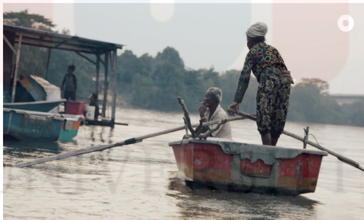
Gambar 4: Orang Seletar