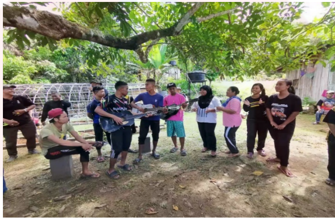
Gambar 10: Orang Seletar Yang Moden

Pada awalnya, Orang Seletar tinggal dalam kelompok yang besar dalam sebuah penempatan. Namun, penempatan Orang Seletar tersebut telah berpecah kepada dua penempatan yang berlainan kerana berlakunya tiga peristiwa atau konflik iaitu penularan penyakit berjangkit, konflik tanah dan masalah ilmu hitam. Pada akhir tahun 1970-an dan awal 1980-an, penempatan asal Orang Seletar telah diserang oleh pelbagai penyakit misteri seperti penyakit kulit dan telah mengakibatkan ramai Orang Seletar meninggal dunia. Selain itu, perebutan tanah telah wujud menjadi penduduk bertambah renggang dalam kalangan penduduk. Ia menyebabkan hubungan sesama penduduk menjadi bertambah renggang. Penduduk kampung juga menjadi sasaran percubaan ilmu hitam yang mengakibatkan penduduk kampung meninggal dunia. Perpindahan penduduk rentetan dari masalah yang separuh penduduk mengambil keputusan berpindah ke kampung baru.