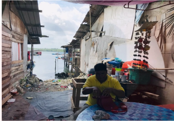
Gambar 5: Rumah di Persisiran Pantai