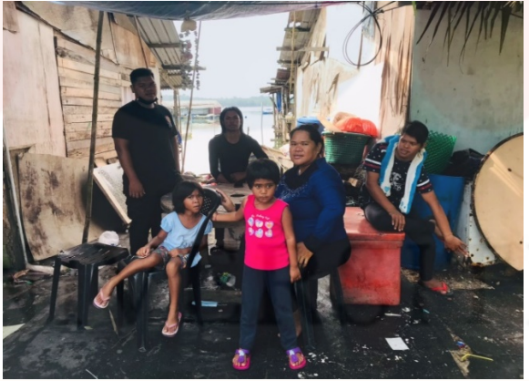
Gambar 2: Orang Asli Seletar di Kampung Teluk Kabung