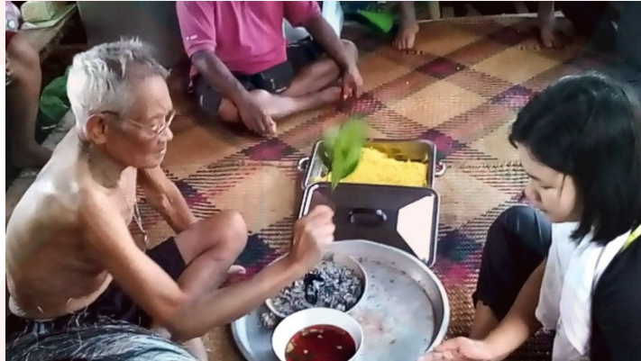
Gambar 12: Upacara Menepung Tawar