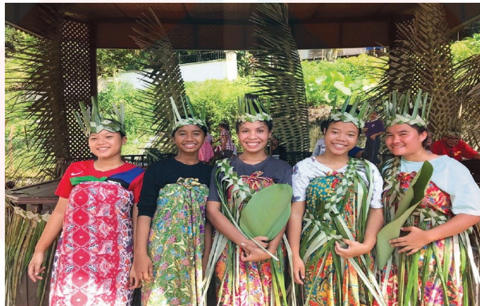
Gambar 3: Adat dan Warisan Orang Asli

Pada awalnya, perkataan genetik bahasa melayu adalah orang asli yang telah digunakan di Malaysia secara formal untuk ditunjukkan kepada orang asli yang mendiami Tanah Melayu sejak dahulu. Secara keseluruhan, suku kaum orang asli yang berasal dari semenanjung Malaysia adalah 18 yang telah menetap sejak dahulu lagi. Kemudian, mereka dibahagikan kepada tiga kumpulan utama iaitu Negrito atau Semang yang selalu ditemui di kawasan Utara semenanjung. Manakala, kategori yang kedua ialah suku kaum Senoi yang menetap di bahagian tengah semenanjung dan yang seterusnya ialah Proto-Malay atau lebih disebut juga nama melayu asli yang tinggal di bahagian wilayah selatan Semenanjung Tanah Melayu. Suku kaum orang asli ini dibahagikan berdasarkan genetik dan asal usul mereka. Di samping itu, golongan yang agak lain daripada masyarakat bumiputera yang lain turut dikenali sebagai orang asli.