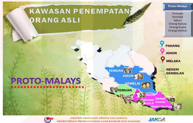
Gambar 6: Taburan Penduduk Proto Melayu

berkomunikasi antara satu sama lain. Kaum ini juga dikenali dengan nama lain iaitu orang Selitar, Slitar, Kon Seletar, Kon dan Orang Selat menurut sumber Wikipedia.