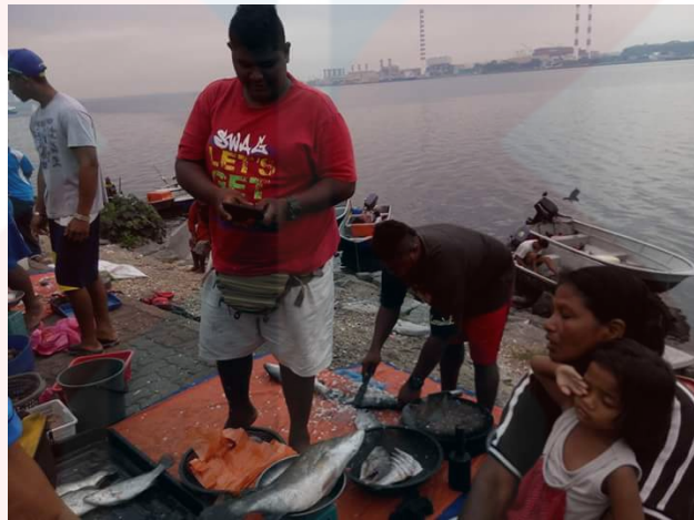
Gambar 8: Aktiviti Jual Beli

panjangnya 22 kaki dan lebar 6 kaki. Pada zaman dahulu kala, Orang Seletar mengamalkan ilmu hitam bagi menzahirkan perasaan tidak puas hati mereka kepada orang lain. Dalam masa yang sama, mereka mengamalkan agama adat yang menggariskan penghormatan kepada pengamalan amalan agama adat yang menggariskan penghormatan kepada kuasa halus yang mengawal laut dan penghormatan yang rasmi kepada nenek moyang. Sebagai kesannya, pengamalan yang dipegang hampir sahaja ditinggalkan kerana pemelukan islam dan Buddha serta Kristian telah menular.