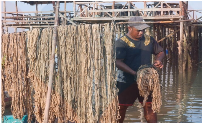
Gambar 7 : Jala Untuk Menangkap Ikan