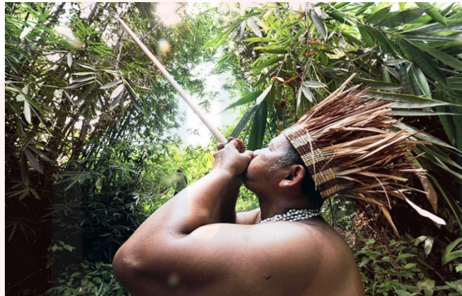
Gambar 9: Aktiviti Memburu di Hutan

Terdapat dua kaedah generasi muda Orang Seletar disosialisasikan iaitu pertunjukan oleh ibu bapa kemudian kemahiran tersebut melalui pengamalan dengan kawan-kawan. Ibu bapa Orang Seletar menunjukkan terlebih dahulu kemahiran tersebut dan kemudiannya dilaksanakan oleh anak-anak. Sekiranya anak-anak telah matang dan mampu untuk berdikari, anak-anak akan dibiarkan mempraktikkan kemahiran tersebut bersendirian atau bersama-sama rakan-rakan mereka. Kanak-kanak Orang Seletar mempraktikkan kemahiran istimewa tersebut bersama-sama dengan rakan-rakan mereka. Perkara yang memalukan jika sekiranya mereka tidak tahu berenang atau menyelam kerana kelemahan tersebut akan menjadi bahan ejekan rakan-rakan mereka.