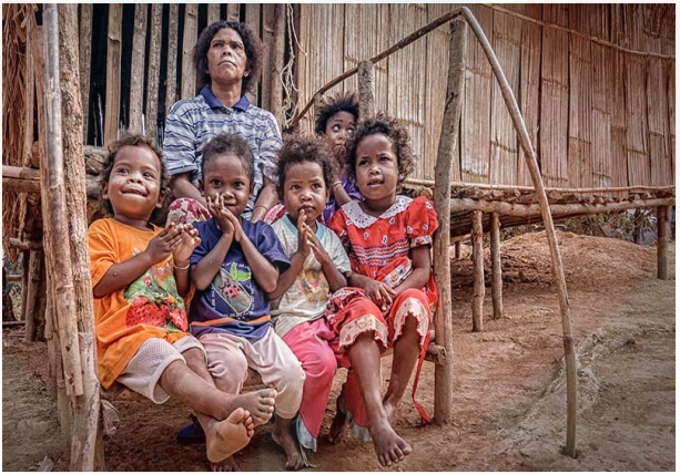
Gambar 1: Orang Asli