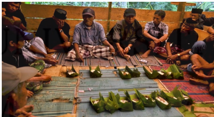
Gambar 11: Perbincangan Antara Jiran Tetangga