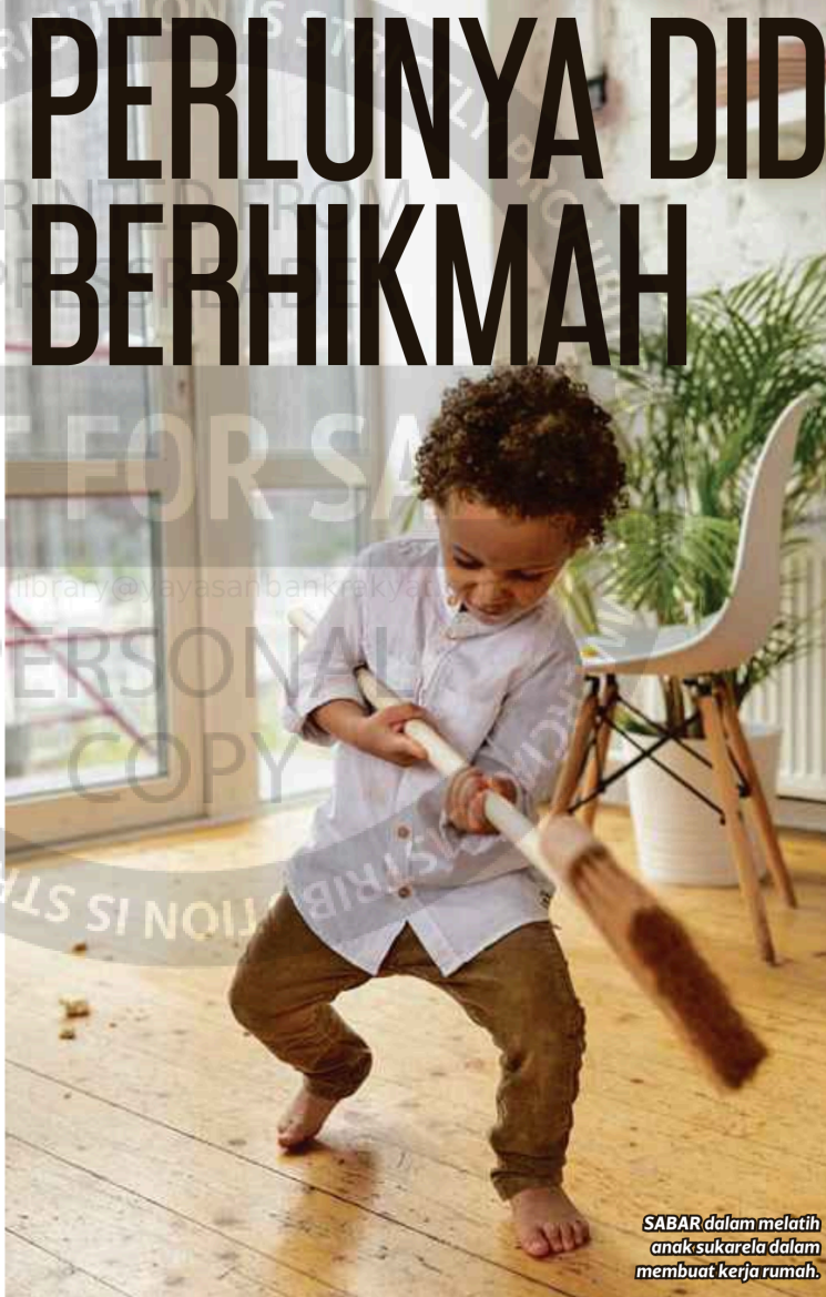
SABAR dalam melatih anak sukarela dalam membuat kerja rumah.

Menariknya, kerja-kerja kecil di rumah sebenarnya menjadi latihan awal kepada pembentukan empati.