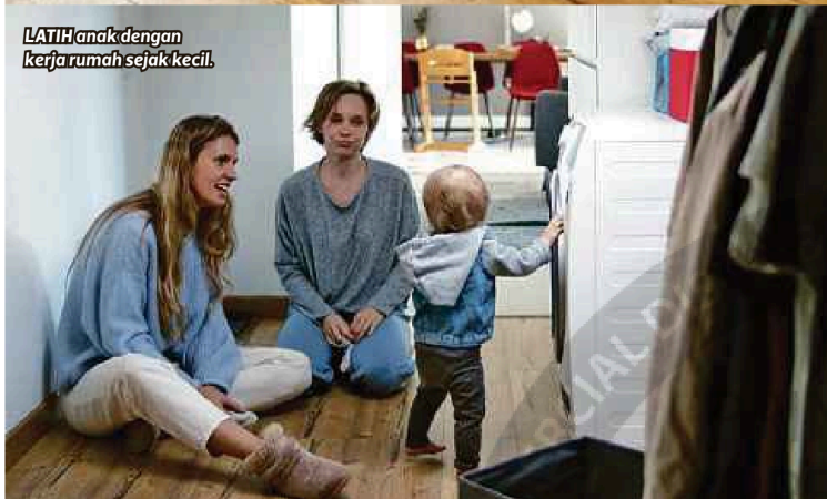
LATIH anak dengan kerja rumah sejak kecil.

Apabila anak terbiasa membantu ibu bapa, mereka akan lebih peka terhadap kesusahan orang lain.