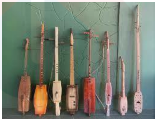
Gambar 2 : Pelbagai alat muzik Sundatang

Selain itu, beberapa individu juga memainkan Sundatang semasa waktu lapang sebagai cara untuk menghilangkan rasa bosan atau sebagai hobi. Aktiviti ini membuktikan bahawa kehadiran Sundatang tidak hanya terbatas kepada aspek tradisional semata-mata, tetapi juga telah berkembang menjadi satu aktiviti yang menghiburkan dan memenuhi keperluan rekreasi masyarakat setempat. Ini menunjukkan adaptabiliti Sundatang dalam masyarakat moden serta kesinambungan penting warisan budaya ini dalam kehidupan seharian masyarakat Sabah.