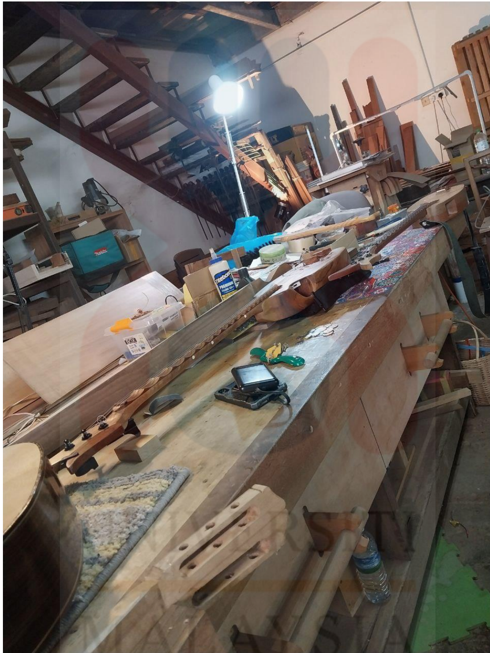
Gambar 7 : Bengkel pembuatan alat muzik En. Roger