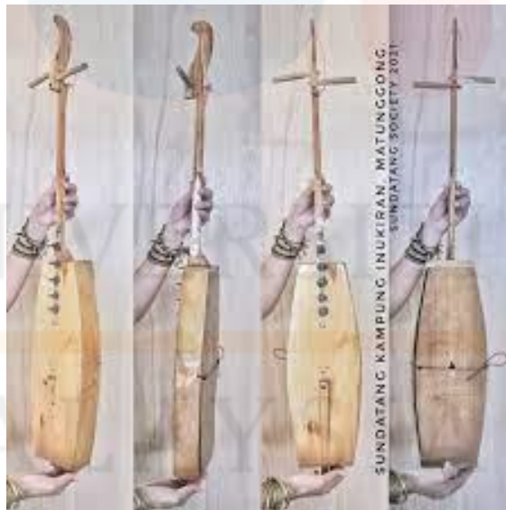
Gambar 1 : Alat muzik Sundatang

Kajian yang akan pengkaji jalankan ialah merupakan kajian yang bertajuk Teknik Pembuatan Alat Muzik Sundatang Dalam Kalangan Suku Kaum Dusun di Kota Kinabalu, Sabah. Alat muzik tradisional Sundatang ini merupakan satu produk warisan yang berasaskan flora dan fauna menurut Jacqueline Pugh-Kitingan (2020). Kajian ini dijalankan untuk mengumpul maklumat mengenai masyarakat Dusun tentang kewujudan alat muzik Sundatang ini terhasil dan perkembangannya, menghurai proses-proses pembuatan alat muzik tersebut serta mengetahui repertoire yang dimainkan dengan menggunakan alat muzik Sundatang ini. Kewujudan alat muzik Sundatang ini perlu kita ketahui kerana tidak semua masyarakat mengetahui tentang alat muzik Sundatang ini. Jadi kita hendaklah mengetahui bagaimana terwujudnya alat muzik Sundatang ini dan asal dari daerah mana yang pertama membuat alat muzik Sundatang ini. Seterusnya, menghuraikan proses dalam pembuatan alat muzik Sundatang yang menjadikan asas untuk menghasilkan sebuah alat muzik Sundatang yang siap. Selain itu, mengetahui repertoire dimainkan dengan menggunakan alat muzik Sundatang ini.