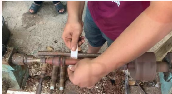
Gambar proses melicinkan kayu menggunakan kertas pasir