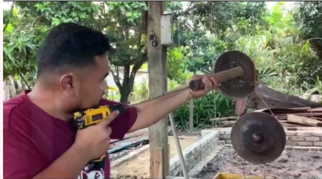
Gambar proses menebuk lubang angin