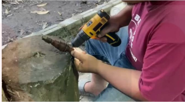
Gambar proses menebuk lubang penjarian