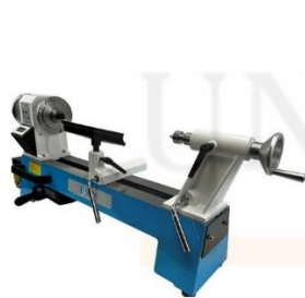
2. MESIN LARIK