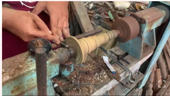
Gambar proses melarik kecopong