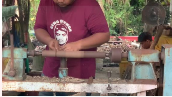
Gambar proses melarik batang serunai