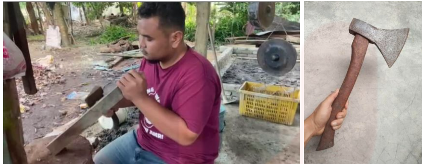
Gambar proses menarah kayu