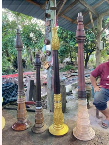
Gambar proses mengukir dan mewarna