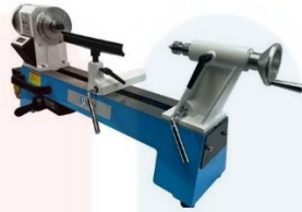
2. MESIN LARIK