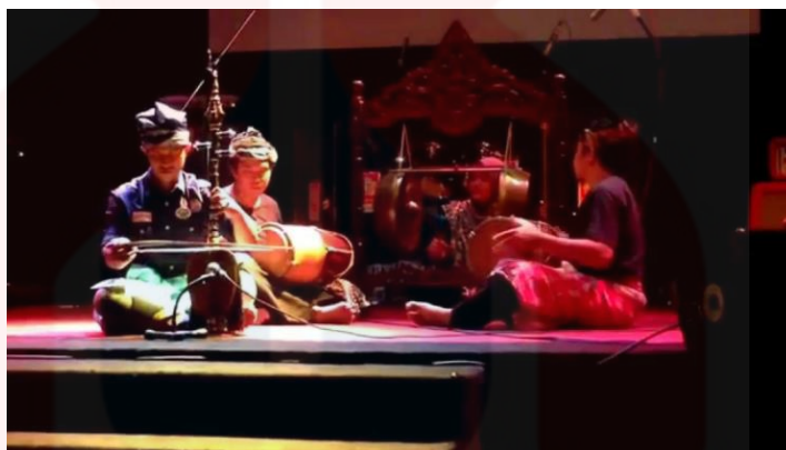
alat Muzik Makyong

Selain itu, gong digunakan untuk memberikan elemen bunyi yang khusus dan memberi isyarat tertentu dalam pertunjukan Makyong. Gong sering digunakan untuk menandakan perubahan babak atau situasi dalam lakonan. Canang dan kesi sebagai salah satu alat muzik Makyong. Alat-alat muzik ini bekerja bersama untuk menciptakan latar muzik yang khas untuk pertunjukan Makyong, menambahkan dimensi artistik dan estetika kepada pengalaman pertunjukan secara keseluruhan.