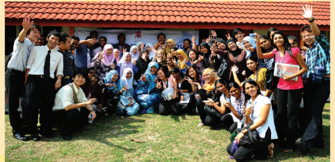
Sebahagian peserta yang menghadiri Bengkel 'Empowering Women Through Entrepreneurship'.