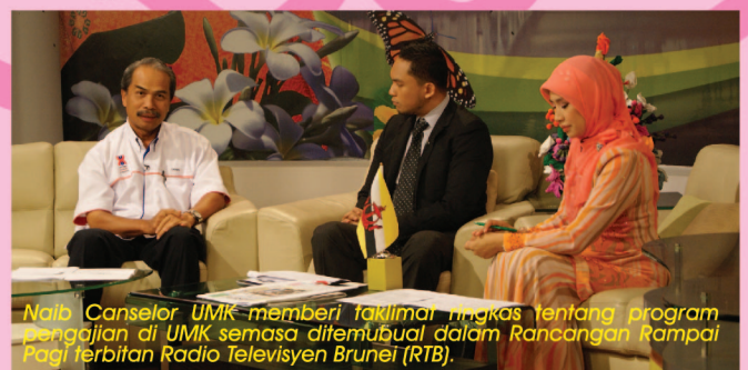
Naib Canselor UMK memberi taklimat ringkas tentang program pengajian di UMK semasa ditemu-bual dalam Rancangan Rampai Pagi terbitan Radio Televisyen Brunei (RTB).