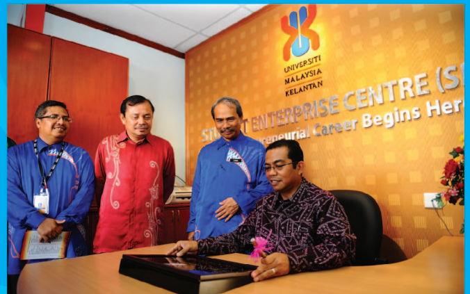
Majlis pelancaran Student Enterprise Centre (SEC) oleh Dato' Seri Mohamed Khaled melakar sejarah baru UMK.