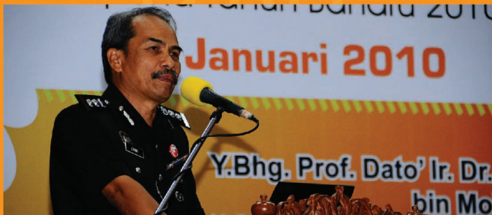
Naib Canselor menyampaikan amanat Sempena Tahun Baharu 2010.