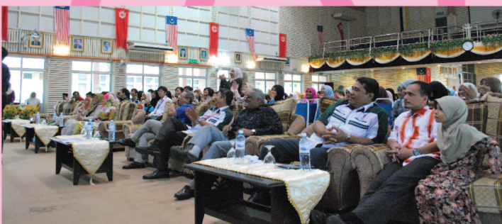
Tetamu yang hadir pada Majlis Perjumpaan Bersama Dekan FASA dan Penyampaian Sijil Anugerah Dekan FASA Semester 1 Sesi 2009/2010.

KECEMERLANGAN akademik dan kokurikulum disifatkan sebagai sama penting bagi melahirkan graduan berkualiti, iaitu menepati keperluan negara dalam usaha melahirkan modal insan kelas pertama.