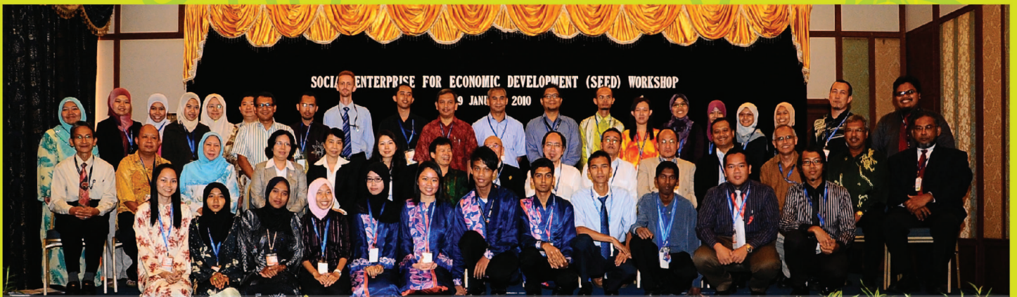
Staf dan pelajar UMK bersama delegasi Asean Learning Network Council semasa menghadiri Bengkel Social Enterprise for Economic Development (SEED)

UNIVERSITI MALAYSIA KELANTAN (UMK) telah menjadi tuan rumah kepada Mesyuarat ASEAN Learning Network Council (ALNC) Ke-4 dan Bengkel Social Enterprise for Economic Development (SEED) dari 9 hingga 10 Januari 2010.