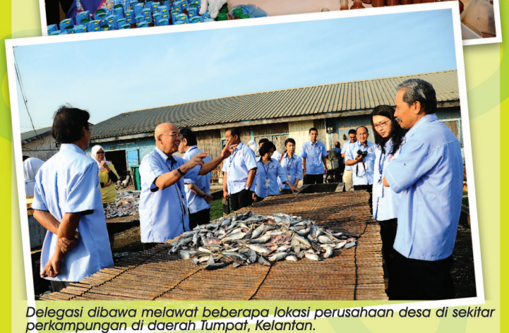
Delegasi dibawa melawat beberapa lokasi perusahaan desa di sekitar perkampungan di daerah Tumpat, Kelantan.