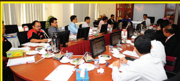
Menteri Perdagangan Antarabangsa dan Industri (MITI), Y.B. Dato Seri Mustapa bin Mohamed semasa mempengerusikan mesyuarat di UMK.