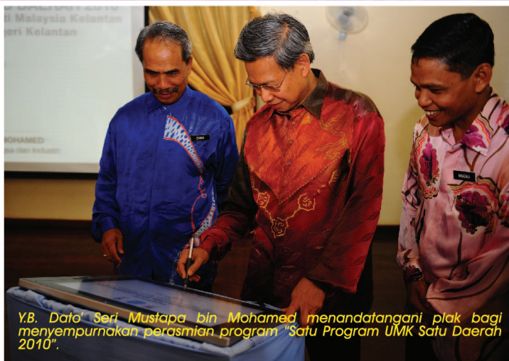
Y.B. Dato' Seri Mustapa bin Mohamed menandatangani plak bagi menyempurnakan perasmian program "Satu Program UMK Satu Daerah 2010".

Selain itu, program itu juga menekankan kemahiran bahasa Inggeris melalui Programme of English Language Improvement at School , Program Usahawan Muda (Sekolah Menengah), Memperkasakan Persatuan Ibu Bapa dan Guru (PIBG) Sekolah dan Kerja Sosial di Sekolah.