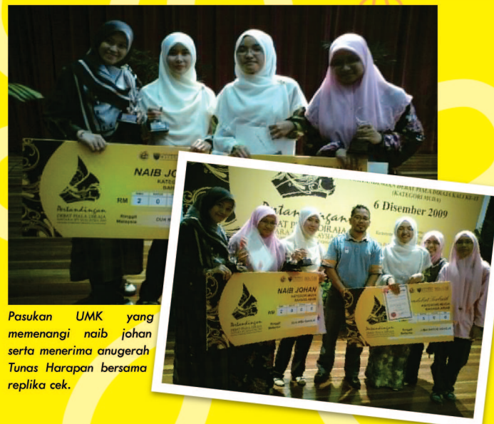
Pasukan UMK yang memenangi naib johan serta menerima anugerah Tunas Harapan bersama replika cek.

"Kemenangan itu amat bermakna kerana pertandingan kali ini amat sengit apabila kita terpaksa bersaing dengan pasukan yang lebih berpengalaman seperti Universiti Kebangsaan Malaysia (UKM), Universiti Malaya (UM) dan Universiti Islam Antarabangsa Malaysia (UIAM)," katanya.