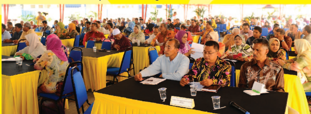
Sebahagian 200 usahawan IKS mengambil peluang untuk mengutarakan dilema dan masalah yang membebankan mereka selama ini.

Objektif sesi dialog bersama MITI itu adalah bagi menyelami masalah sebenar pengusaha di samping memastikan bantuan kerajaan dapat disampaikan kepada usahawan IKS bumiputera dengan berkesan.