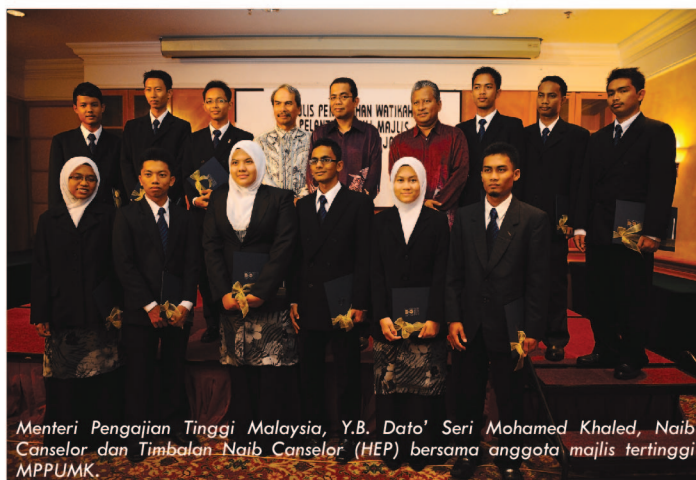
Menteri Pengajian Tinggi Malaysia, Y.B. Dato' Seri Mohamed Khaled, Naib Canselor dan Timbalan Naib Canselor (HEP) bersama anggota majlis tertinggi MPPUMK.

Pelajar Universiti Malaysia Kelantan (MPPUMK) 2010 perlu memandangkan berat kepercayaan yang diberikan kepada mereka dan memikul tanggungjawab masing-masing dengan baik.