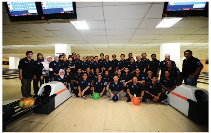
Kejohanan Bowling UMK bersama Media Kelantan merapatkan lagi hubungan silaturahim kedua-dua pihak.

Antara pasukan media yang mengambil bahagian ialah pasukan BERNAMA, Utusan Malaysia, Berita Harian, Sinar Harian, Harian Metro, Kosmo, New Straits Times, RTM, TV3, Nanyang Slang Pau, Sing Chew Daily dan China Press.