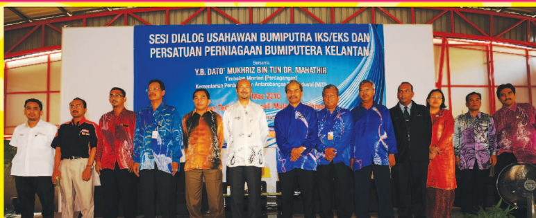
Sesi Dialog Usahawan IKS Bersama Timbalan MITI, Y.B. Dato Mukhriz berjaya mencapai objektif.

LEBIH 200 usahawan Industri Kecil dan Sederhana (IKS) hadir dalam Program Sesi Dialog Usahawan Bumiputera IKS dan Persatuan Perniagaan Bumiputera Kelantan Bersama Timbalan Menteri Perdagangan Antarabangsa dan Industri, Y.B. Dato' Mukhriz bin Tun Mahathir.