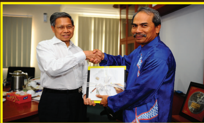
Pemilihan UMK dalam SME-University Internship Programme beri peluang pada mahasiswa-siswi menjadi usahawan.

Setiap pelajar terbabit akan menerima elaun sebanyak RM600 sebulan sepanjang tempoh latihan tersebut. Kumpulan ini berpeluang melaksanakan modul latihan berkaitan keusahawanan menerusi beberapa siri ceramah daripada usahawan dan Panel Penasihat Pakar EKS.