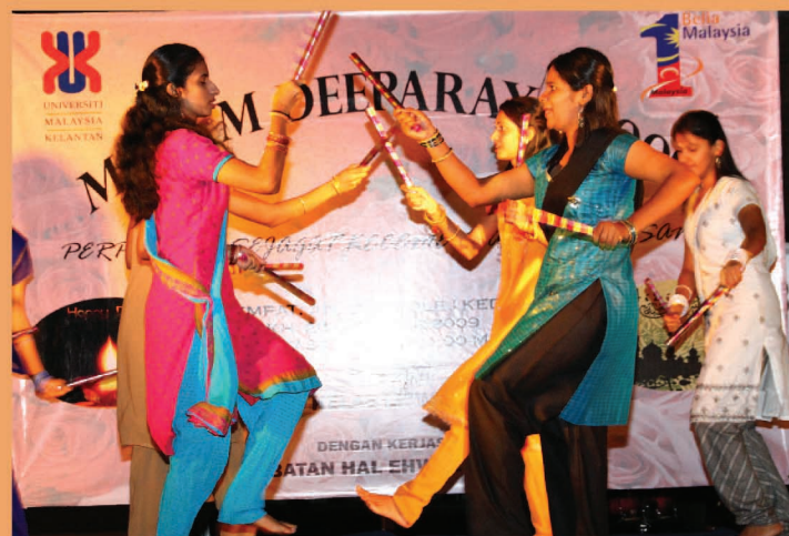
Semangat 1Malaysia yang ditunjukkan oleh warga UMK menyemarakkan lagi ikatan sesama bangsa.