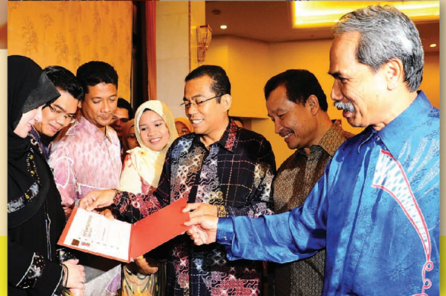
Menteri Pengajian Tinggi bersama para penerima Anugerah Perkhidmatan Cemerlang 2008.