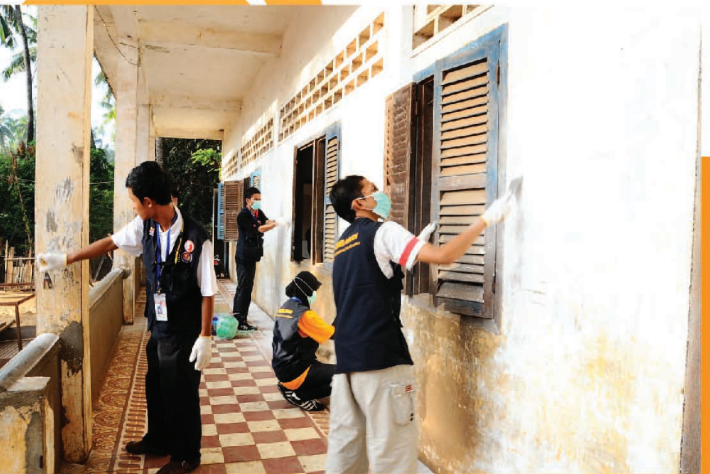
Sebahagian sukarelawan warga UMK mengecat bangunan sekolah di Kampung Thom, Kemboja.