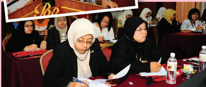
Sebahagian peserta mendengar taklimat yang diberikan.