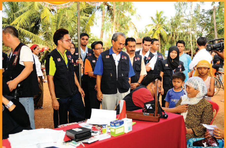
Penduduk diberi rawatan kesihatan percuma oleh pihak UMK.