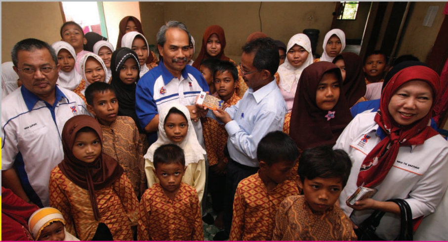
Program bantuan kemanusiaan di Padang, Indonesia.