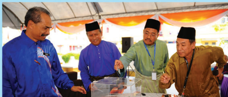
Sumbangan daripada warga UMK.