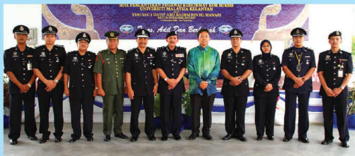
Para pegawai yang menerima pangkat di Majlis Pemakaian Pangkat dan Penyampaian Sijil Pelantikan Pegawai Kehormat Kor SUKSIS UMK.