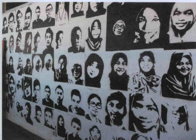
Imej 2 : Karya stensil yang dibuat menggunakan cat semburan hitam pada dinding fakulti.

Malah sebuah kelas di bawah penyeliaan encik Firuz telah menghasilkan potret ini sekali lagi ke atas dinding fakulti untuk diabadikan sebagai kenangan, atau mungkin sebagai satu inspirasi untuk pelajar. Dalam masa yang sama, Encik Azmeer telah memberi peluang kebebasan kepada pelajar-jarnya untuk meluahkan ekspresi masing-masing untuk menghasilkan kesan-kesan stensil yang lebih radikal di sekitar fakulti. Kebebasan ini tanpa disangka telah mendapat reaksi yang sangat menggalakkan dari pelajar sehingga kebanyakan dinding kosong di fakulti telah dipenuhi dengan imej-imej dan suara bebas dari pelajar. Walaupun beberapa karya telah dipadamkan atas dasar ketidaksesuaiannya, namun apa yang lebih penting, pelajar telah mendapat pendedahan yang baik sebagai nilai tambah pembelajaran.