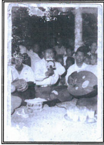
Rajah 1. Kumpulan Gampus Sedang Mengadakan Persembahan Sekitar Awal Tahun Enam Puluhan