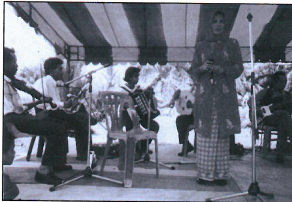
Rajah 6. Kumpulan Gambus Nurulhilal Sedang Mengadakan Persembahan

Persembahan biasa dimulakan dengan lagu-lagu puji-pujian kepada Rasulullah S.A.W seperti lagu Ya-Rasulullah dan Ya Nabi Salam Munalai 19 . Lagu-lagu ini akan dinyanyikan oleh penyanyi utama kumpulan gambus yang juga bermain gambus. 20 Selain lagu-lagu puji-pujian kepada Rasulullah S.A.W, lagu-lagu lain yang biasanya dipersembahkan adalah lagu-lagu untuk mengiringi tarian sama ada tarian zapin atau pun sarah. Sebelum lagu dimainkan, pemain gambus akan terlebih dahulu memainkan 'taqsim'. Taqsim adalah 'cadenza' lagu sebelum sesebuah lagu sebenar dimain dan dinyanyikan. Taqsim perlu dimainkan dalam nada atau 'maqam' yang sama dengan lagu yang bakal dinyanyikan.