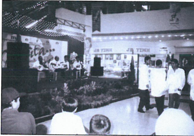
Rajah 7. Kumpulan Gambus Nurulhilal Sedang Mengiringi Tarian zapin

digunakan ketika memainkan lagu-lagu sarah dan zapin. Lagu-lagu Melayu ini diibaratkan sebagai 'pembuka selera' kepada persembahan sebenar yang dinanti-nantikan.