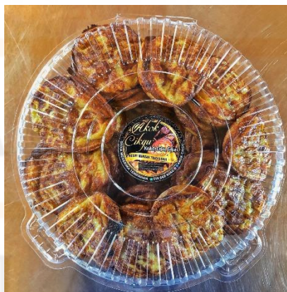
Gambarajah 2.4.2 menunjukkan kaedah pembungkusan makanan yang digunakan oleh perniagaan 'Akok Cikgu'.

Setiap produk perniagaan memerlukan pembungkusan bagi melindungi keselamatan dan ketahanan produk yang dihasilkan. Pelbagai perkara penting perlu diambil kira bagi menghasilkan pembungkusan yang baik. Ciri-ciri rekabentuk pembungkusan perlu mengikut kesesuaian produk yang dihasilkan dan juga rekabentuk yang mampu menarik perhatian pengguna. Menurut pandangan Zuzana Sedlacekova (2017), pembungkusan mempunyai ciri yang tersendiri dan memerlukan banyak pengetahuan dalam mencipta pembungkusan yang selamat. Produk pembungkusan memerlukan tahap suhu serta kelembapan yang sesuai bagi mengekalkan rupa, bentuk dan kesegaran. Oleh itu, proses penghasilan pembungkusan perlulah mengandungi bahan yang sesuai daripada ancaman dan boleh mengubah sifatnya. Menurut pandangan Nur Asfarina (2015), pembungkusan berfungsi sebagai medium antara pihak pengusaha yang memasarkan produk dengan para pengguna. Tujuan rekabentuk pembungkusan dihasilkan adalah sebagai penghubung menerusi rekabentuk fizikal pembungkusan serta menggunakan elemen warna, tipografi dan imej yang kreatif yang diciptakan oleh pereka grafik bagi tujuan mempengaruhi minat dan citarasa pengguna.