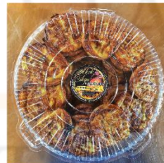
Gambarajah 4.5 menunjukkan logo dan pembungkusan asal bagi PKS Tempatan Akok Cikgu.