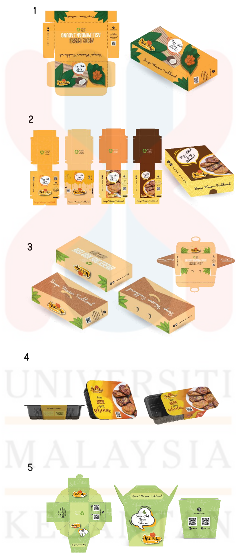
Gambarajah 4.6.3 menunjukkan pilihan rekabentuk pembungkusan