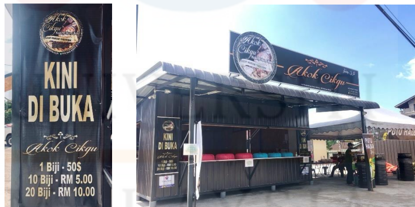
Gambarajah 2.4.3 menunjukkan banting dan papan tanda yang dimiliki oleh perniagaan

Terdapat banyak kelebihan dalam penghasilan poster, risalah atau banting yang diperolehi bagi sesebuah perniagaan kerana ianya merupakan salah satu cara pengiklanan yang membuatkan pelanggan mendapatkan informasi dengan lebih cepat dan dekat. Menurut pandangan, Mohd Helmi Abd Rahim (2009), pengiklanan berperanan sebagai penghubung kepada sesuatu produk yang dipasarkan. Melalui pengiklanan, keuntungan dan peningkatan barangan mampu meningkat dari masa ke semasa. Oleh itu, pengusaha perlu menggunakan inovasi dan kreativiti dalam penghasilan iklan yang berhasil dan berjaya. Perbandingan harga dan kualiti juga dapat dilakukan apabila kaedah pengiklanan digunakan oleh pengusaha-pengusaha produk bagi menyampaikan maklumat kepada pengguna. Menurut Carter (1989), dipetik oleh Svetlana Frolova, (2014), prinsip pemasaran akan lebih berkesan melalui pengiklanan yang menyampaikan mesej kepada pembeli mengenai produk dan sifatnya.