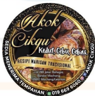
Gambarajah 2.4.1 diatas menunjukkan logo bagi perniagaan 'Akok Cikgu'

Simbol bagi sesebuah perniagaan adalah menerusi penghasilan logo. Logo yang baik mampu memberi kesan yang positif kepada perniagaan yang diusahakan. Bagi Mohd Amin (2016), beliau berpendapat bahawa logo perniagaan membantu di dalam penciptaan identiti dan jenama bagi sesebuah syarikat atau perniagaan kerana fungsi utama logo perniagaan adalah untuk memberi inspirasi kepada kepercayaan, pengiktirafan serta kesetiaan pengguna terhadap sesuatu perniagaan. Creative Revolution (2017), menyifatkan bahawa logo adalah reka bentuk atau simbol unik yang mewakili organisasi. Perniagaan yang berjaya akan mengaplikasikan setiap rekabentuk logo pada semua pemasaran mereka, bermula dari tandatangan e-mel, persuratan dan sebagainya. Kelebihan logo pada syarikat adalah supaya dikenali dengan lebih mudah dan kebiasaannya syarikat besar dan berjaya menggunakan jenama ringkas bagi perniagaan mereka.