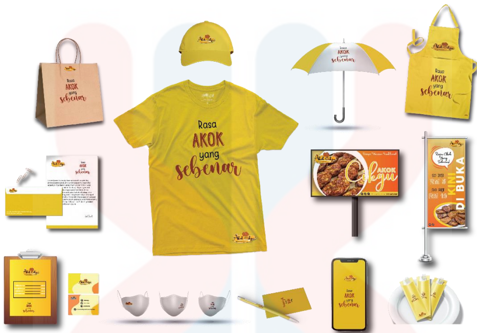
Gambarajah 4.6.5 menunjukkan idea 2 identiti korporat