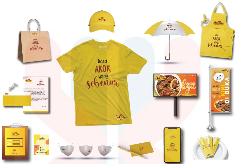
Gambarajah 4.8.3 menunjukkan rekabentuk identiti korporat produk yang dipilih.