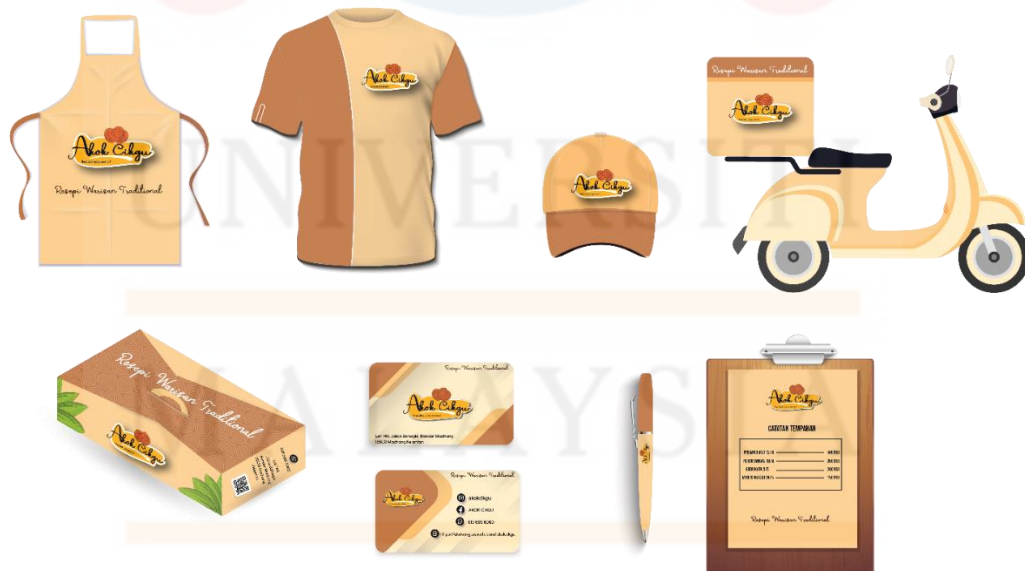
Gambarajah 4.6.4 menunjukkan idea 1 identiti korporat