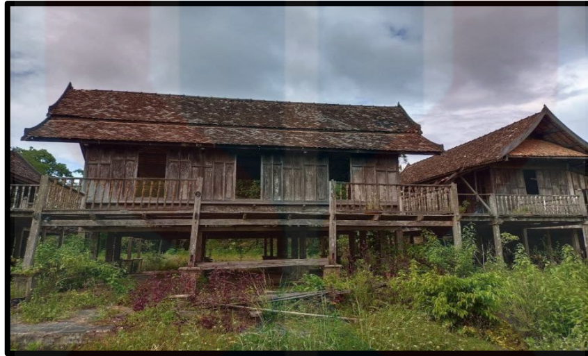
Rajah 4.1 Pura Tanjung Sabtu, Terengganu

ini sebagai tempat untuk membuat songket. Namun begitu, dua daripada sepuluh orang responden menyatakan mereka kurang pasti dengan sejarah disebalik terbinanya Pura Tanjung Sabtu.