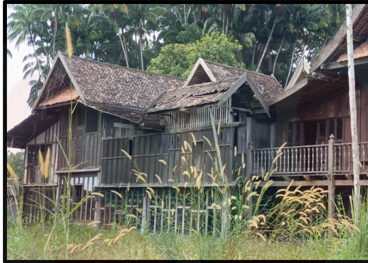
Rajah 4.3 : Pura Tanjung Sabtu, Terengganu