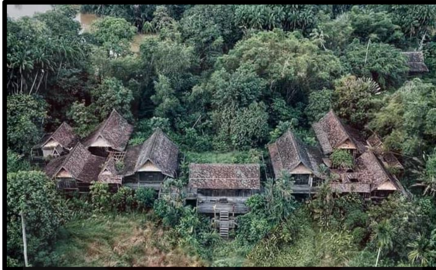
Rajah 1.1 : Pura Tanjung Sabtu, Terengganu