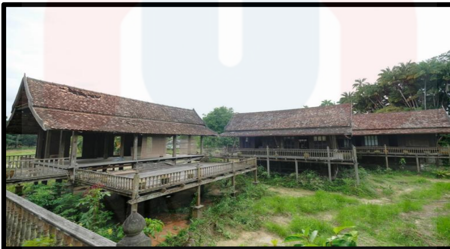
Rajah 1.2 : Pura Tanjung Sabtu, Terengganu

Kesimpulannya, pengkaji dapat lihat Pura Tanjung Sabtu telah dibiarkan tanpa pengawasan dalam jangka masa yang lama. Disebabkan oleh kematian satu-satunya pemilik Pura Tanjung Sabtu. Pura Tanjung Sabtu mempunyai potensi yang besar untuk dijadikan sebagai tempat pelancongan. Oleh itu, pengkaji akan menumpukan kepada sejarah, keistimewaan dan kepentingan yang ada pada peninggalan ini.