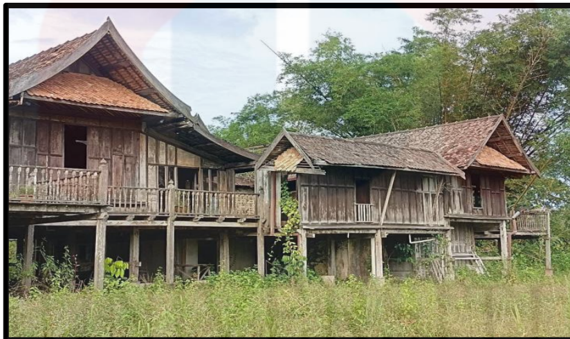
Rajah 4.2 : Pura Tanjung Sabtu, Terengganu

Berdasarkan temubual yang dijalankan, kesemua responden tidak bersetuju akan persoalan tentang adakah Pura Tanjung Sabtu ini akan kekal teguh dalam jangka masa yang lama. Pada pendapat responden C, Pura Tanjung Sabtu ini terbiar dan tiada usaha pemeliharaan dan pengawasan yang berskala dilaksanakan ke atas bangunan ini dalam masa yang sudah lama. Oleh itu, potensi untuk bangunan tersebut untuk kekal teguh dalam jangka masa yang lama adalah amat tipis. Seperti yang dilihat oleh pengkaji, banyak bahagian-bahagian pada bangunan tersebut sudah rosak yang disebabkan oleh pelbagai faktor. Antara kerosakannya adalah beberapa bahagian atap sudah roboh, kayu reput dan sebagainya.