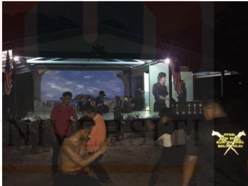
Rajah 4 : Latihan bagi Jurus Tempur 31 (siku lanun)

Jurus Tempur 31 (siku lanun) merupakan salah satu persembahan silat tempor di atas kapal pada zaman nenek moyang dahulu. Di dalam persembahan silat kuntau jawa ini jurus tempur 31 (siku lanun) ini juga dikenali sebagai persembahan untuk berlawan. Langkah pertama di dalam jurus tempur 31 ini dikenali sebagai pecah bunga satu iaitu pemain akan memberi salam atau memberi penghormatan serta memberitahu kepada penonton bahawa persembahan akan dimulakan. Seterusnya ialah pemain akan memulakan dengan jurus-jurus asas pergerakan silat iaitu dengan membuka tapak silat sebelum memasuki ke peringkat yang seterusnya.