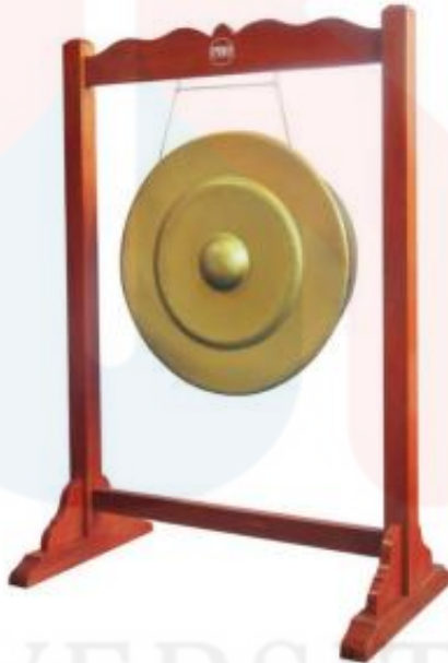
Rajah 10: Alat muzik gong

Gong atau lebih dikenali sebagai tetawak merupakan alat muzik yang dikelaskan sebagai alat muzik idiofon. Pada zaman dahulu gong ini diperbuat daripada tembaga dengan dindingnya yang tebal namun pada masa kini gong ini diperbuat daripada tembaga atau besi dengan dindingnya yang agak nipis. Terdapat dua jenis iaitu gong ibu dan gong anak dan bagi membezakan gong ibu dan gong anak adalah apabila mendengar nada atau pic gong tersebut.