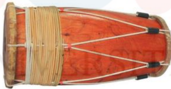
Rajah 7: Gendang ibu

Gendang ibu atau dikenali juga sebagai rebana ibu merupakan salah satu alat muzik yang utama di dalam persembahan silat kuntau jawa ini. Gendang ibu ini juga boleh dikategorikan sebagai alat muzik paluan yang dipukul menggunakan tapak tangan dan jari bagi menghasilkan bunyi. Permukaan gendang ibu ini diperbuat daripada kulit kambing dan bahagian kayu bulatnya iaitu merupakan kerangka gendang yang diperbuat daripada kayu Tualang Kudung Tunggal. Kelebaran permukaan gendang ibu ini berukuran sekitar 13-16 inci mengikut garis pusatnya. Namun saiz bagi gendang ibu ini adalah tidak tetap kerana ianya bergantung kepada saiz kayu dan citarasa pembuatnya.