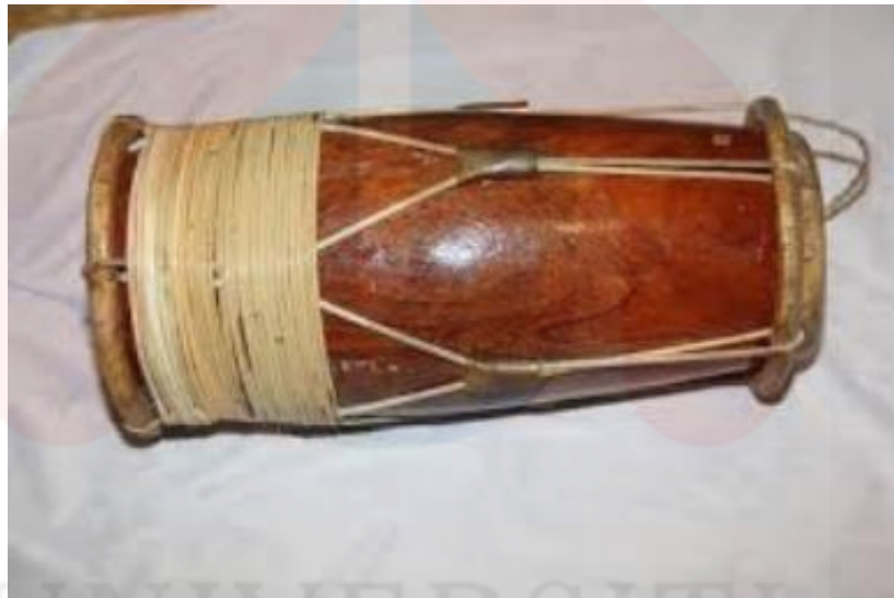
Rajah 8: Gendang anak

Gendang anak mempunyai bentuk sama lebih kurang dengan gendang ibu namun saiznya lebih kecil daripada gendang ibu. Gendang anak mempunyai tebukan dalaman yang dibuat menggunakan buluh seruas supaya dapat menghasilkan nada yang tinggi. Baluh atau temalangnya diperbuat daripada kayu jenis nangka, kayu senor, kayu pauh dan sebagainya. Saiz gendang anak juga tidak tetap kerana ianya juga mengikut kepada saiz kayu yang digunakan dan mengikut citarasa pembuatnya.