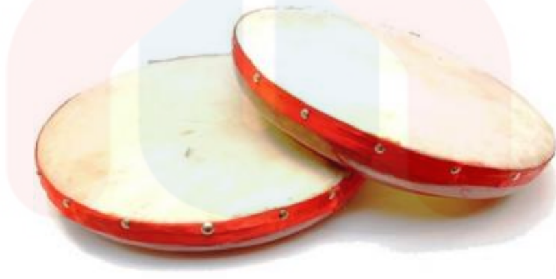
Rajah 11: Alat muzik kompang

Kompang merupakan sejenis alat muzik tradisional yang popular bagi masyarakat Melayu. Kompang juga tergolong di sebagai alat muzik gendang dan kompang kebiasaannya diperbuat daripada kulit kambing betina namun pada masa kini ini kompang diperbuat daripada kulit lembu atau kerbau. Untuk pembuatan kompang rotan akan diselit di bahagian belakang antara kulit dan bingkai kompang bertujuan untuk meregangkan permukaan dan suaya bunyi yang dihasilkan itu menjadi kuat.