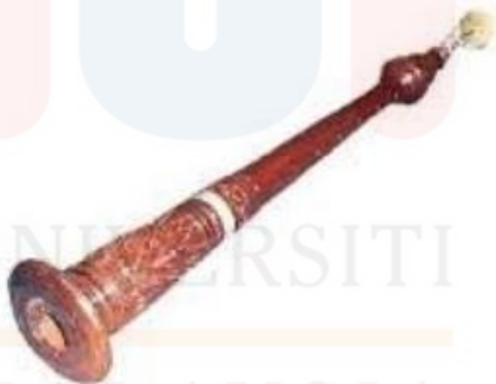
Rajah 9: Alat muzik serunai

Serunai atau lebih dikenali sebagai alat erofon (alat tiupan) merupakan salah satu alat muzik yang menghasilkan melodi. Serunai ini sering digunakan untuk mengiringi persembahan-persembahan tradisional seperti wayang kulit, menora dan silat. Serunai juga mempunyai tujuh lubang petik atau dikenali sebagai lubang penjarian dan mempunyai satu lubang petik sebagai lubang untuk meletakkan ibu jari. Serunai ini menghasilkan bunyi yang tinggi dan juga nada-nada yang bersifat riang ataupun galak. Alat muzik serunai ini pipitnya diperbuat daun pokok lontar yang sederhana tua dan alat ini diperbuat daripada kau dan batangnya berbentuk kon.