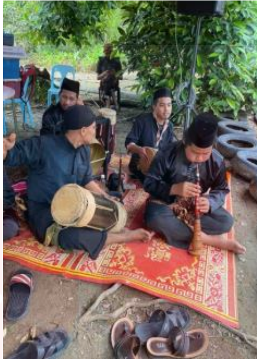
Rajah 12: Gendang Muzik Pertubuhan Penggerak Seni Warisan (PPSW)

Sehubungan dengan itu, di dalam silat kuntau jawa ini tidak mempunyai lagu-lagu yang tertentu untuk mengiringi persembahan silat tersebut. Namun hanya terdapat satu lagu sahaja yang digunakan di dalam persembahan silat kuntau jawa ini iaitu lagu irama silat. Lagu irama silat di dalam persembahan silat kuntau jawa ini adalah bertujuan untuk menambahkan semangat dan untuk hiburan sahaja kepada pesilat sewaktu latihan diadakan.