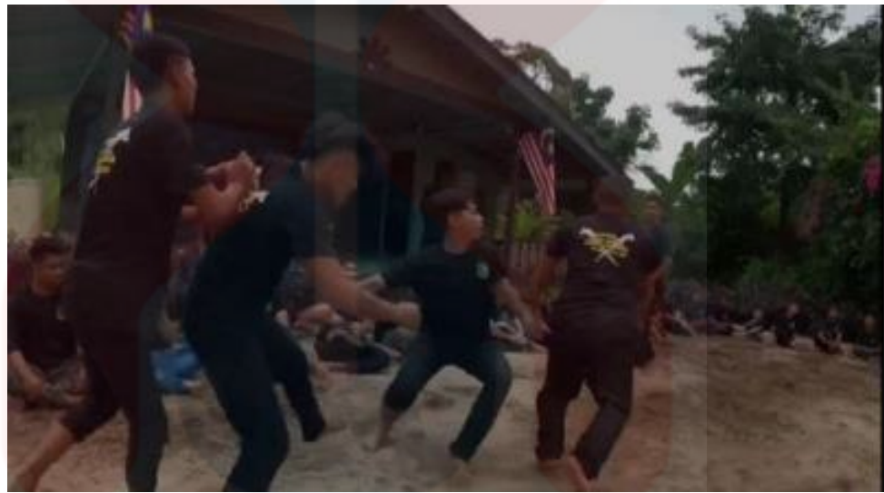
Rajah 6: Pesilat telah diserang oleh musuh

Namun begitu, menurut ketua pemuda Penggerak Seni Warisan tersebut beliau mengatakan bahawa kesemua latihan yang dilakukan tidak menunjukkan cara-cara untuk mematikan latihan atau menamatkan latihan. Hal ini kerana beliau berkata kesemua latihan yang diadakan hanyalah sekadar untuk berkongsi dan latihan semata-mata.