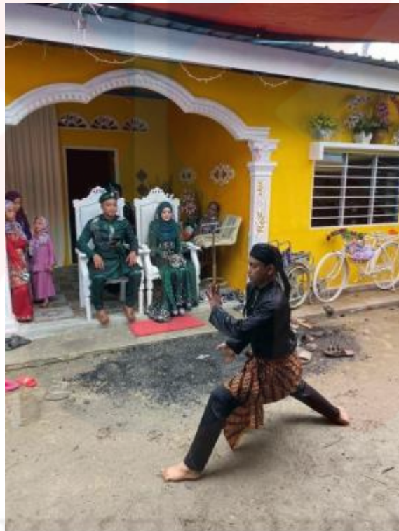
Rajah 5 :Persembahan silat di majlis perkahwinan

Oleh itu di dalam persembahan untuk majlis-majlis pernikahan atau majlis-majlis tertentu tidak mempunyai langkah yang spesifik untuk ditetapkan. Langkah-langkah untuk majlis ini terjadi kerana timbul keserasian antara pasangan itu sendiri dan telah direka oleh pasangan itu sendiri untuk menampakkan langkah atau bunga tersebut lebih cantik mengikut gerak tari yang bersesuaian.