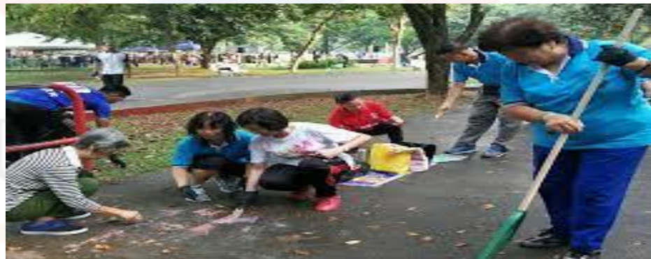
Gambar 4.7: Aktiviti Gotong Royong

Soalan ketiga ialah kebersihan dan keselamatan di tapak warisan ini merupakan tanggungjawab komuniti setempat ia dapat mewujudkan psikologi yang positif terhadap komuniti sekitar menunjukkan seramai 184 orang responden (74.2%) memilih sangat setuju, seramai 49 orang responden (19.8%) memilih setuju, pemilihan agak setuju mendapat seramai 11 orang responden (4.4%), manakala untuk tidak setuju dan sangat tidak setuju masing-masing sebanyak 2 orang responden (0.8%).