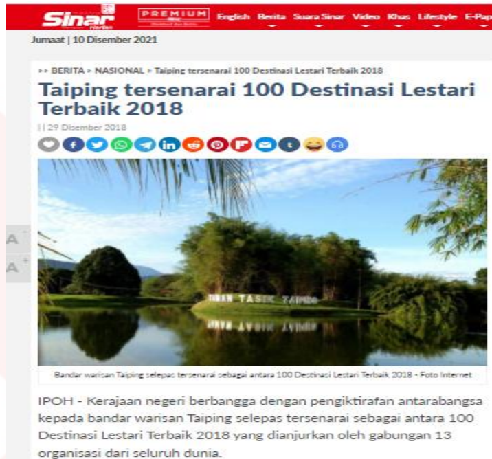
Gambar 4.2: Keratan Akhbar Pengiktirafan Taman Tasik Taiping, Perak