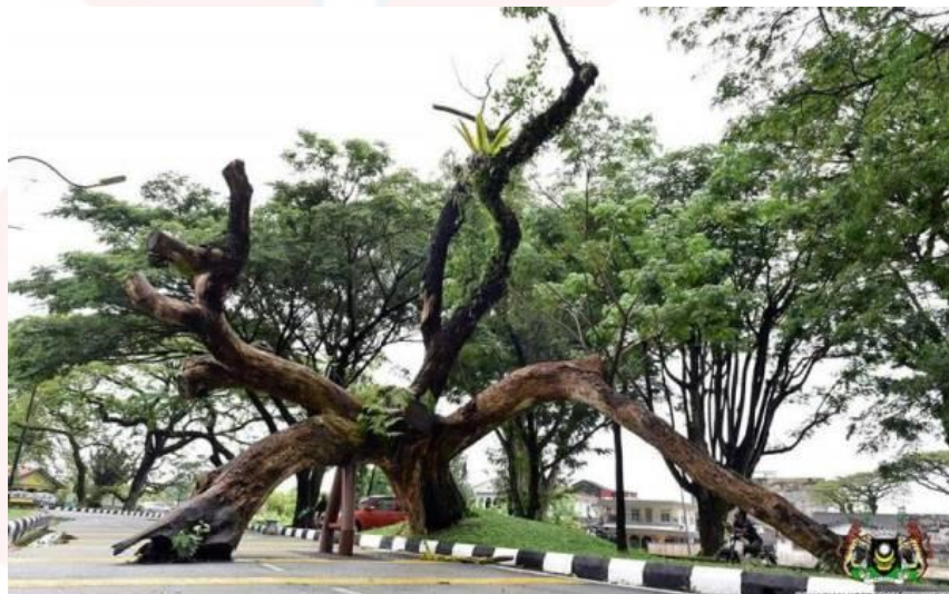
Gambar 4.5: Pokok Hujan-Hujan Melebihi Usia 130 Tahun.

Perkara kelima ialah berkenaan soalan pokok hujan-hujan atau nama saintifiknya Samanea Saman yang terdapat di taman tasik ini dapat dilihat di laluan Raintree Walk yang menjadi ikon bagi bandar Taiping kerana telah bertahan lebih dari 130 tahun ini. Hasil analisis data telah mendapat sebanyak 230 orang responden (92.7%) mengatakan ya, manakala seramai 18 orang responden (7.3%) menyatakan tidak.