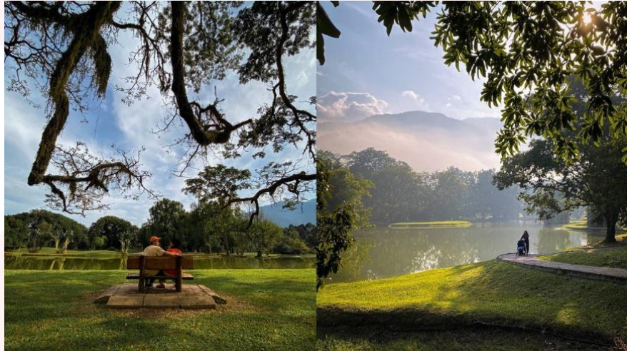
Gambar 4.1: Suasana Hijau Dan Tenang Di Persekitaran Taman Tasik Taiping.

mengetengahkan kawasan hijau, lapang berkontur dan pokok-pokok besar, ia juga dikatakan menyamai Kensington Park iaitu taman awam yang tercantik di London pemilihan jawapan ya seramai 221 orang responden (89.8%), berbanding pemilihan jawapan tidak sebanyak 25 orang responden (16.2%).