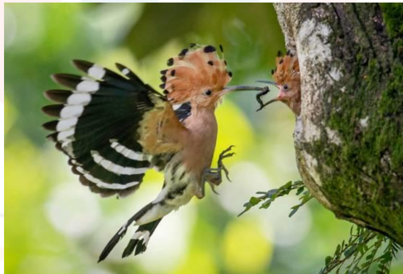
Gambar 4.3: Pasangan burung jantan dan betina spesies itu mula dikesan membuat sarang di Pokok Jemerlang

semulajadi ini wajar diiktiraf sebagai tapak warisan semulajadi di Malaysia dan dunia, seramai 233 orang responden (94%) memilih jawapan ya, manakala jawapan tidak seramai 15 orang responden (6%). Soalan kedua dalam bahagian ini menyatakan pada tahun 2021, burung Hud-Hud memilih Taman Tasik Taiping sebagai destinasi persinggahan dalam proses pembiakan burung tersebut, ia menjadikan kawasan taman tasik ini merupakan alam semulajadi yang sesuai sebagai persinggahan haiwan yang unik kerana persekitaran yang segar dan tenang, majoriti responden iaitu sebanyak 212 orang (85.5%) menyatakan ya dan seramai 36 orang responden (14%) menyatakan tidak berkenaan persinggahan burung hud-hud ini.