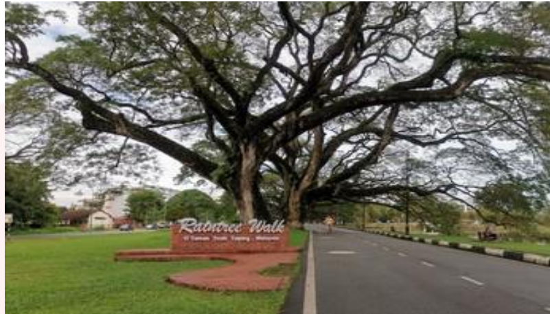
Gambar 4.6: Persekitaran Raintree Walk