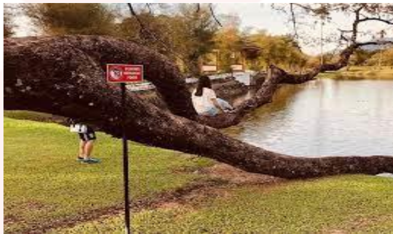
Gambar 4.8: Diatas Adalah Contoh Isu Vandalisme Yang Merosakkan Pokok Dikawasan Taman Tasik

kepada pihak atasan. Hal ini supaya taman tasik tidak dicemari dengan kerosakan dan contengan yang memburukan imej Taman Tasik Taiping. Hasil analisis ini mendapati seramai 174 orang responden (70.2%) memilih sangat setuju, pemilihan setuju mendapat seramai 54 orang responden (21.9%), agak setuju sebanyak 14 orang responden (5.6%), tidak setuju seramai 4 orang responden (1.6%) dan seramai 2 orang responden (0.8%) memilih sangat tidak setuju.