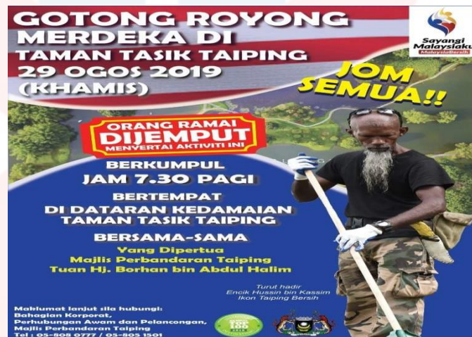
Gambar 4.9: Poster Aktiviti Gotong Royong Merdeka Di Taman Tasik Taiping

orang responden (72.6%), kedua ialah 50 orang responden (20.2%) memilih setuju, pemilihan setuju sebanyak 8 orang responden (3.2%), manakala pemilihan tidak setuju dan sangat tidak setuju ini masing-masing seramai 5 orang responden (2%).