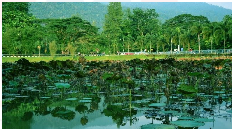
Gambar 4.4: Spesies Tumbuh-Tumbuhan Di Sekitar Kawasan Taman Tasik

Soalan ketiga ialah Taman Tasik Taiping ini memberi manfaat terhadap ekosistem dan ekologi di kawasan sekitar yang menentengkan kehidupan hijau atau alam semulajadi, seramai 233 orang responden (94%) menyatakan ya dan seramai 15 orang responden menyatakan tidak. Perkara keempat dalam bahagian ini terdapat seramai 226 orang responden (91.1%) memilih ya dan 15 orang responden (6%) menyatakan tidak bagi soalan taman tasik ini terdiri terdapat 2,500 jenis batang pokok yang terdiri daripada 75 spesies eksotik seperti teratai putih, pokok seroja, pokok tembusu, pokok hujan-hujan, pokok brazil nut , Jacaranda Filicifolia dan pelbagai jenis spesies tanaman tempatan. Kepelbagaian tanaman hijau ini menjadikan taman tasik ini unik dengan menentengkan elemen tapak warisan alam semulajadi yang mampu bertahan sehingga harini.