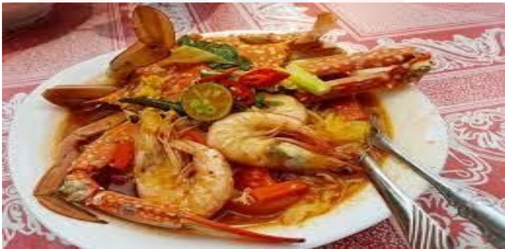
Gambar 4.3.3 : Mee Udang Yang Menjadi Tumpuan Para Pengunjung (Carian Google)

Saya kalau nak melancong saya akan pilih tempat yang banyak alam semulajadi sebab saya nak tenangkan fikiran dan melancong dalam keadaan yang santai sambil melihat sejarah atau warisan yang ada dekat sesuatu tempat tu.