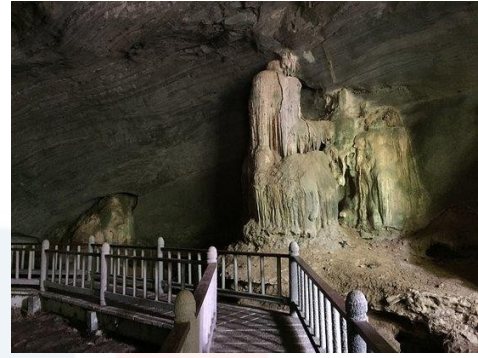
Gambar 4.3 : Hutan Simpan Untuk Jungle Trekking Dan Gua Kelawar (Carian Google)

Selalunya yang datang ke Pulau Tuba akan lebih memilih untuk bergerak secara sendirian tanpa 'tour guide'. Tapi kami akan sarankan untuk pelancong sewa kereta sekali dengan motel supaya senang untuk berjalan-jalan di Pulau Tuba. Tetapi ada juga pelancong yang pilih untuk dibawa oleh 'tour guide'.