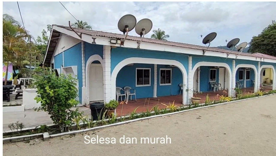
Gambar 4.2: Faridzuan Motel (Carian Google)