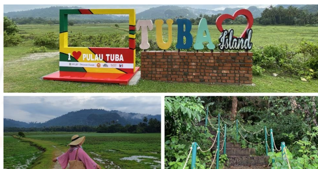
Gambar 4.4: Tempat Menarik Yang Boleh Dilawati Di Pulau Tuba

Tidak seperti dahulu, Pulau Tuba yang sememangnya kurang terkenal dan dikhuatiri akan lemah dari segi pengangkutan tetapi dari hari ke hari, Pulau Tuba mula terkenal dan semakin membangun sehingga telah ditetapkan waktu bagi pelancong untuk menaiki bot ke sana. Disebabkan itu, pelancong dapat mengurus masa dengan baik semasa melancong. Kebanyakan pelancong juga lebih memilih untuk menginap lebih lama di kawasan berkenaan bagi menghirup udara segar di Pulau Tuba (Ismail, 2021).