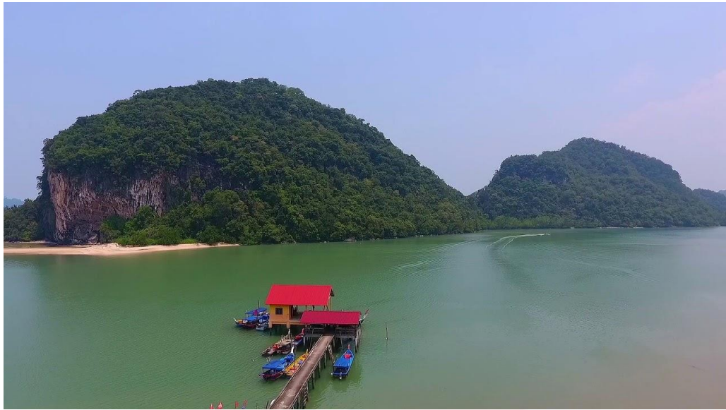
Gambar 4.3.2: Pantai Bagan Asam, Pulau Tuba