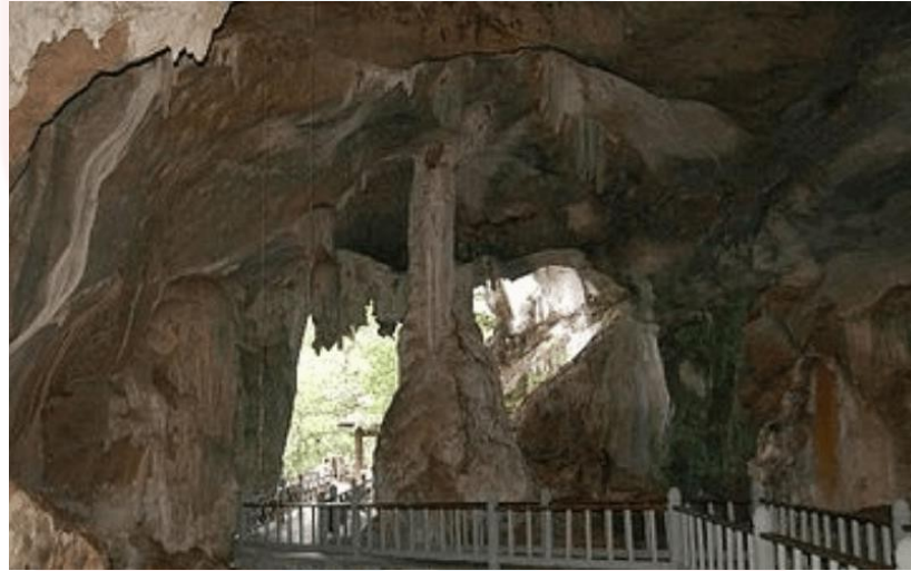
Gambar 4.3.1 : Batu Kapur di Pulau Tuba (Carian Google)

warisan alam semulajadi ini ialah ketiga-tiga warna ini ada pada satu batuan dan dikatakan tidak terdapat di bukitbatu kapur yang lain.