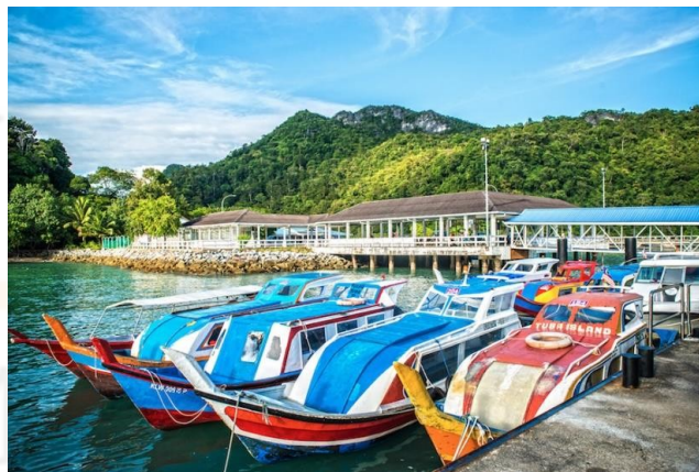
Gambar 4.4 : Bot Yang Dinaiki Pengunjung Ke Pulau Tuba