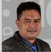
Pensyarah Jabatan Bahasa & Pengajian Umum, Fakulti Perniagaan & Komunikasi, Universiti Malaysia Perlis