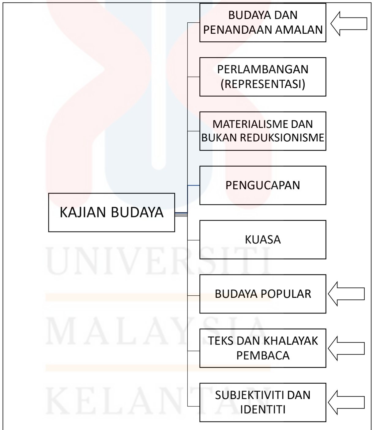
Rajah 2 : Prinsip-Prinsip Teori Budaya Berdasarkan Chris Barker.

penyelidikan intelektual. Namun, perkara ini telah dikaji oleh beliau berdasarkan kajian budaya berkenaan skop buku yang telah dihasilkannya tersebut. Terdapat 8 prinsip yang dikemukakan oleh Chris Barker dalam kajian budaya iaitu budaya dan penandaan amalan, perlambangan (Representasi), materialisme dan bukan reduksionisme, pengucapan, kuasa, budaya popular, teks dan khalayak pembaca serta subjektiviti dan identiti.