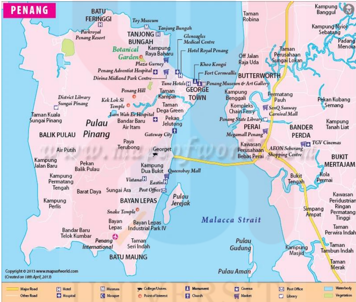
(Gambar rajah 1: Peta Negeri Pulau Pinang)