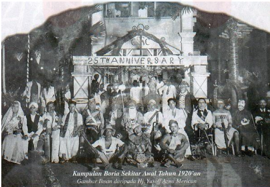
(Gambar rajah4: Kumpulan Boria Awal Tahun 1920 'an)