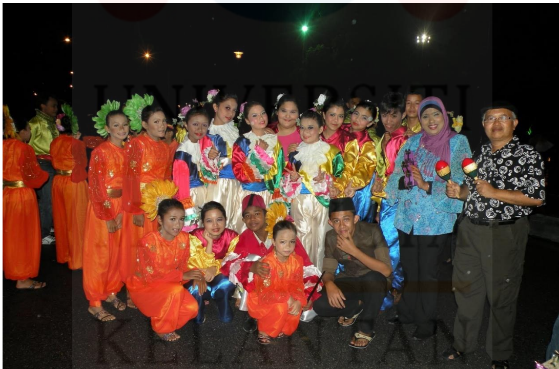
(Kumpulan Boria sekitar tahun 2000)