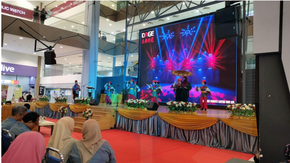
(Persembahan Boria Ommara)