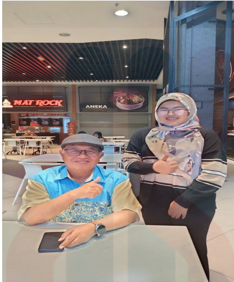
(Bersama dengan Tokoh Boria Pulau Pinang)