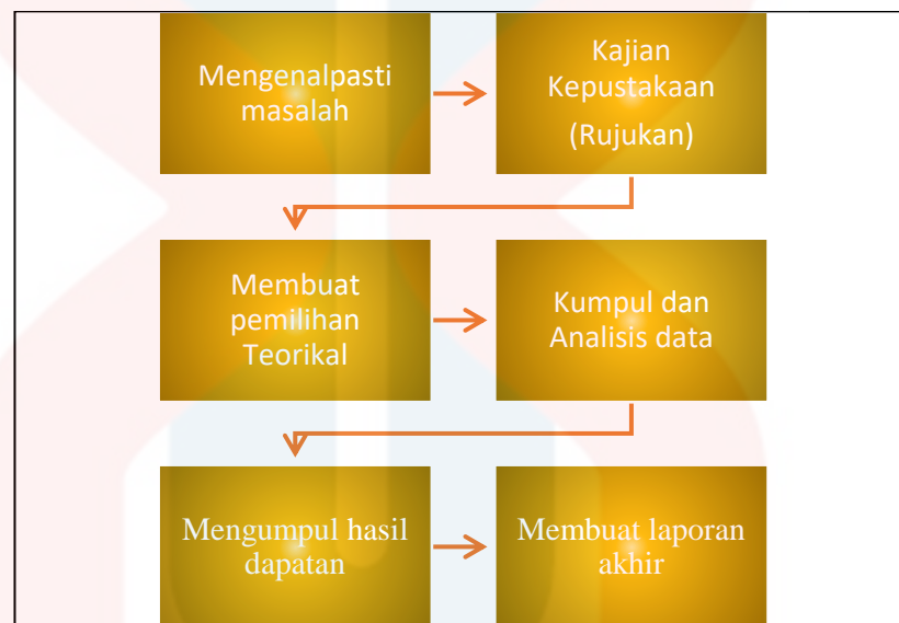
Rajah 3.1: Proses Kajian

Mc.Milan dan Schumacher (1977), menjelaskan bahawa penyelidikan merupakan satu proses sistematik dalam mengumpul dan menganalisis data atau maklumat untuk tujuan-tujuan tertentu. Bagi memberi gambaran mudah kajian yang dijalankan, penjelasan mengenai kaedah kajian yang dilaksanakan dalam penyelidikan ini dirumuskan secara ringkas melalui rajah proses aliran kajian.