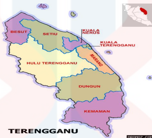
Peta 1: Negeri Terengganu

Terdapat pelbagai platform dalam media baharu seperti media sosial, blog dan forum. Namun kajian ini menumpukan kepada 4 bentuk media baharu iaitu Instagram, Twitter, Facebook dan TikTok. Hal ini kerana, pengengaruh memainkan peranan penting dalam perantaraan terhadap sesebuah masyarakat.