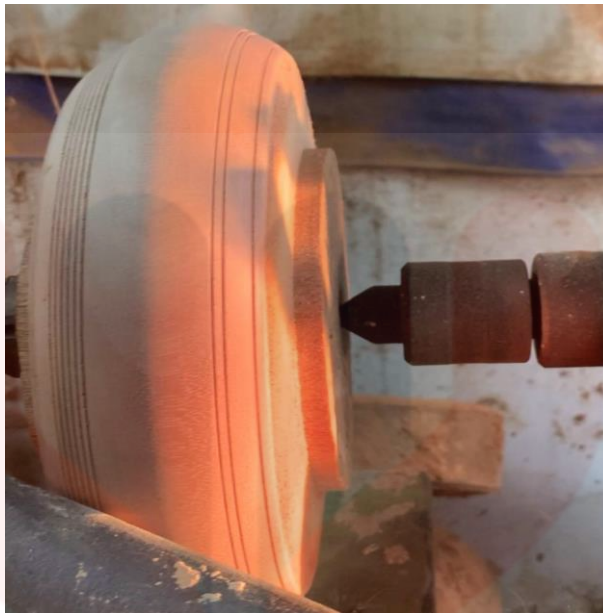
Gambar 14. Ukiran Urat (Garis) Pada Badan Rebana Anak

Apabila ukiran urat siap dilakukan, teknik yang seterusnya ialah, menebuk lubang tengah kayu untuk membentuk bingkai badan rebana anak. Kayu yang siap dilicinkan dan dibuat ukiran urat masih perlu dikekalkan pada mesin larik. Kayu tersebut perlu dibuang pada bahagiannya dan akan berbentuk seperti bulatan sebuah bingkai. Untuk menebuk bahagian tengah bulatan kayu, ianya mesti menggunakan peralatan seperti pahat mata larik. Sama juga seperti proses melicinkan kayu sebentar tadi, pahat mata larik perlu ditajamkan terlebih dahulu sebelum menggunakannya kerana kita ingin mata pahat yang tajam untuk menebuk bahagian tengah kayu yang keras. Apabila mata pahat tumpul, ianya perlu ditajamkan seketika. Di samping itu juga, semasa proses ini dilakukan, kertas pasir turut digunakan bagi melicinkan dan menghaluskan lagi bahagian dalaman bingkai badan rebana anak itu.