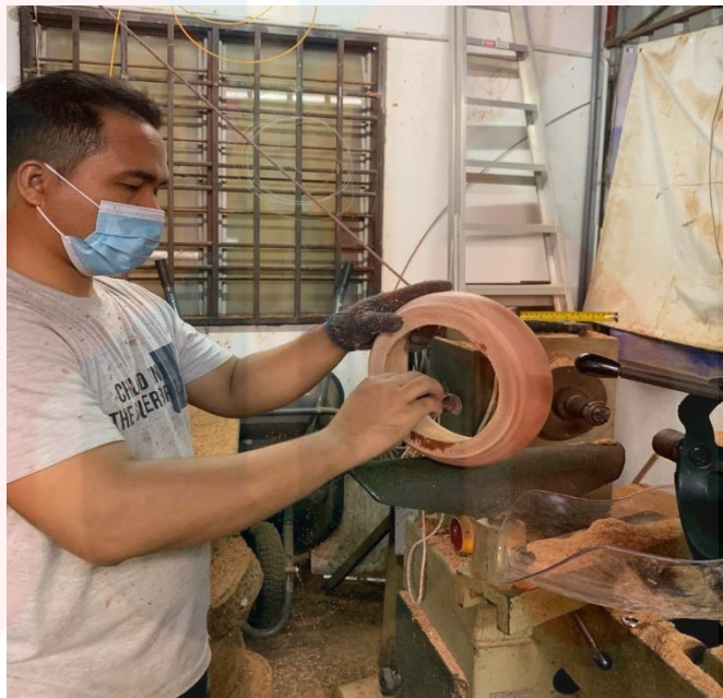
Gambar 16. Bingkai Digosok Dengan Kertas Pasir

Menurut Encik Hanif, selepas bingkai badan rebana anak siap dibuat, kita mesti memahatnya sekali lagi. Hal ini bagi membuang lebih-lebihan kayu yang tidak diinginkan pada dalaman bingkai rebana anak. Selain itu juga menggosok bingkai rebana anak dengan menggunakan kertas pasir bagi mendapatkan kualiti yang halus, tidak berbulu dan licin.