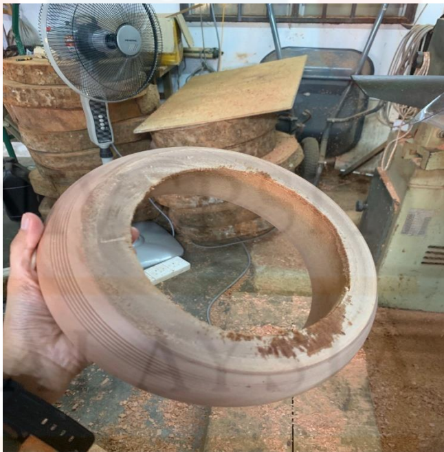
Gambar 15. Badan Rebana Anak Setelah Ditebuk