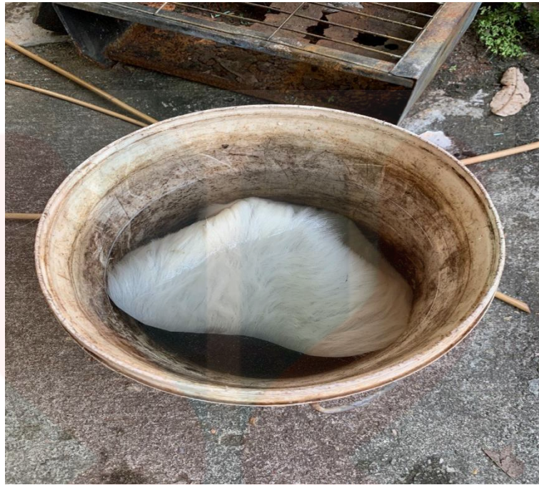
Gambar 19. Kulit Kambing Direndamkan Dan Dibersihkan

Setelah siap dibersihkan, kulit kambing akan dicukur dengan menggunakan pisau jilid. Mata pisau itu mestilah tajam supaya kulit kambing tidak rosak semasa dicukur. Bulu kambing perlu disamakan alurnya sebelum dicukur untuk memudahkan kita untuk mencukurnya.