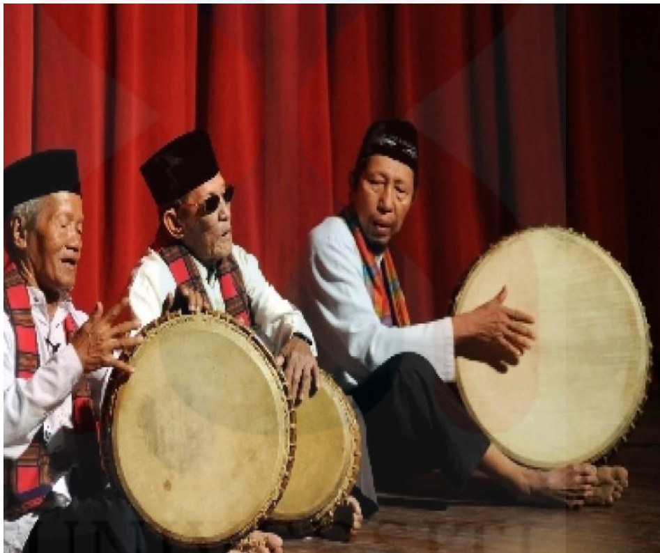
Gambar 4. Cara Rebana dimainkan. 11

Seterusnya, adalah cara rebana dimainkan didalam sesuatu persembahan. Rebana boleh dimainkan secara solo mahupun secara berkumpulan. Pemain alat muzik rebana akan memainkannya secara posisi duduk dan meriba atau memegang rebana tersebut lalu memalunya dengan menggunakan tangan. Bunyi yang dihasilkan oleh rebana adalah berpuncunya daripada kulit haiwan yang telah diregangkan pada badan rebana.