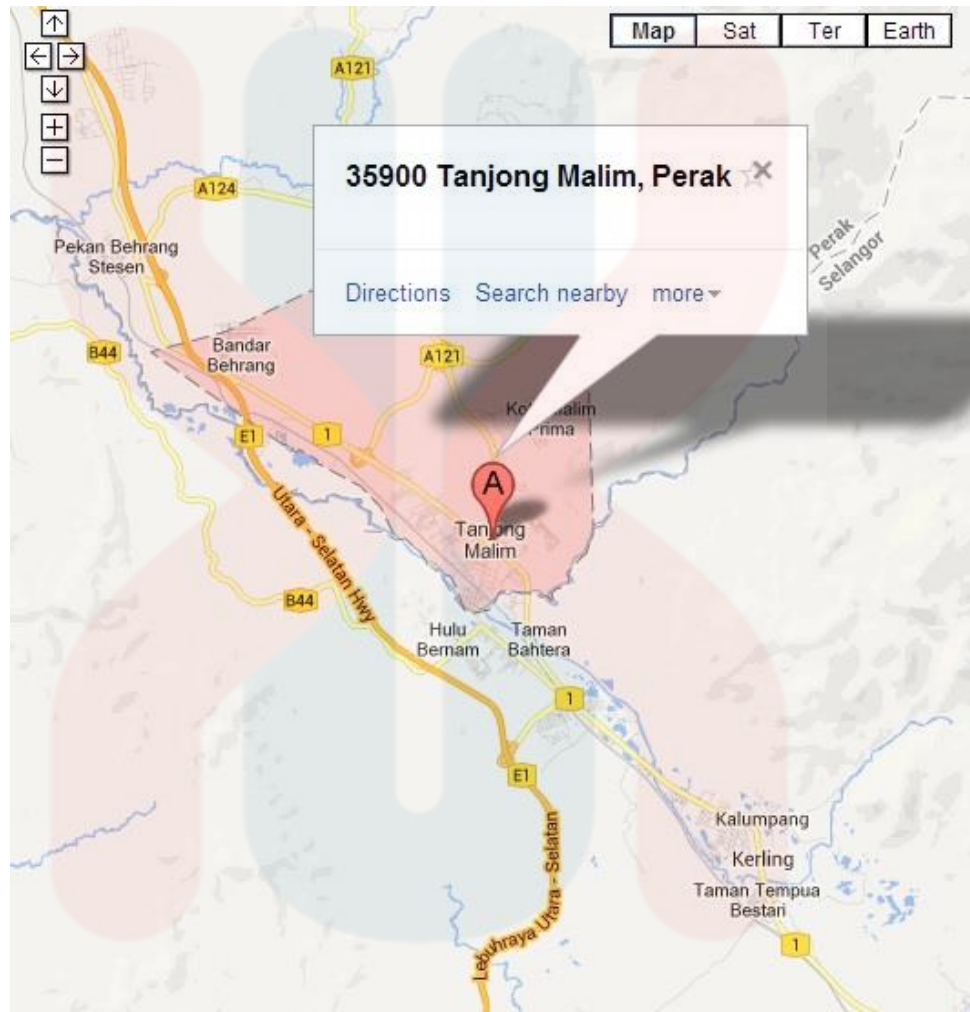
Gambar 1. Peta Tanjung Malim, Perak. 3

mereka. Hal ini demikian kerana, Tanjung Malim turut mempunyai alam sekitar-alam sekitar yang menarik untuk dikunjungi, seperti Sungai Bil dan Teratak Riverview.