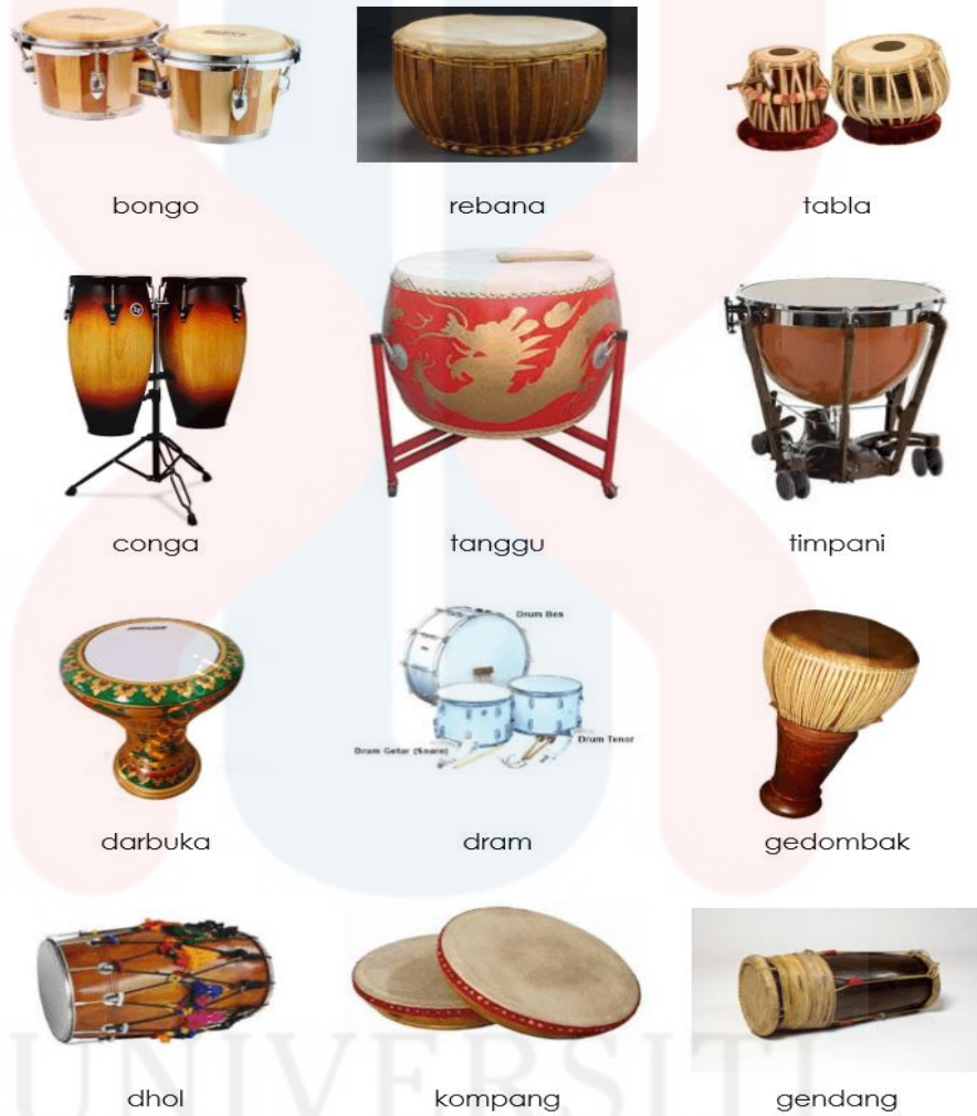
Gambar 3. Alat Muzik Membranofon 10