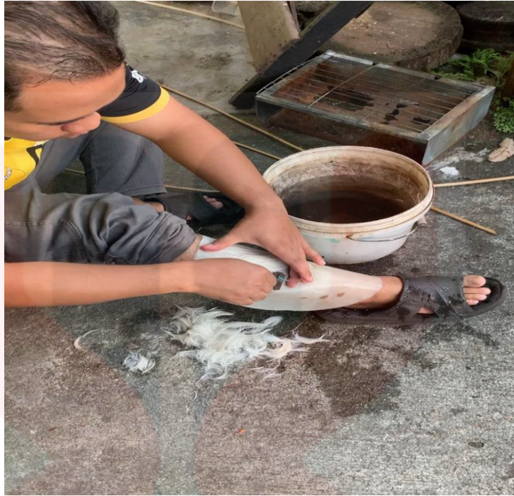
Gambar 20. Kulit Kambing Dicukur

Seterusnya, adalah proses memasang kulit kambing pada badan rebana anak. Kulit kambing akan dipaku pada badan rebana anak dengan menggunakan paku yang bersaiz kecil supaya ianya tidak mudah terkoyak. Proses pemakuan pada kali ini adalah sementara dahulu sebelum bergerak kepada proses yang berikutnya. Kulit kambing perlu ditegangkan lalu dipaku.