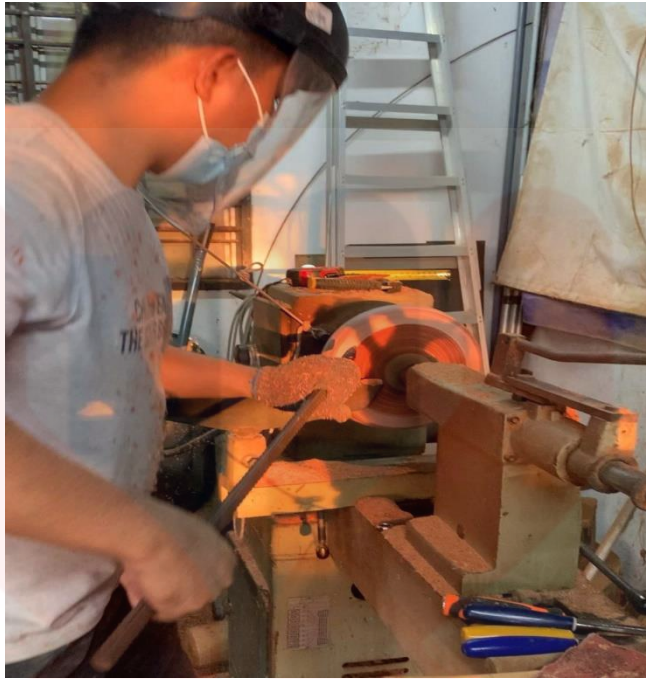
Gambar 14. Proses Menebuk dan Membuang Bahagian Tengah Kayu