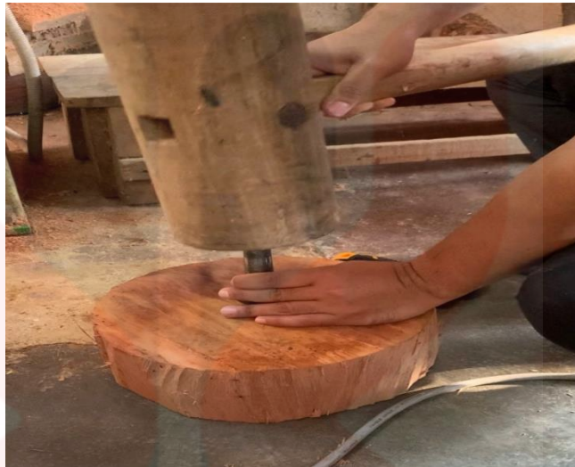
Gambar 8. Bahagian Tengah Kayu Ditandakan

badan rebana anak lebih kelihatan bulat. Hal ini demikian kerana, permukaan dan tekstur kayu adalah tidak sekata dan tidak bulat sepenuhnya.