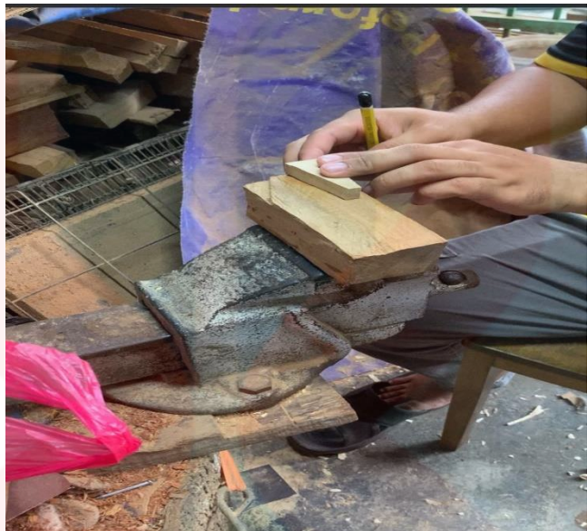
Gambar 18. Proses Membuat Baji

baji tersebut perlu dilicinkan dengan mesin grinder. Baji dibuat bagi membantu pada bahagian tuning ataupun mendapatkan bunyi rebana anak yang baik.