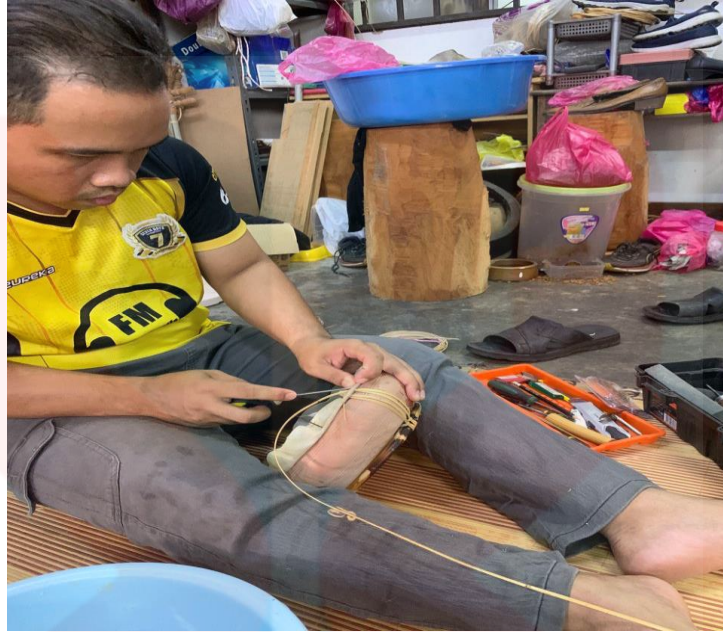
Gambar 22. Proses Merambing