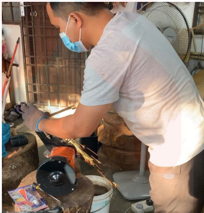
Gambar 10. Pahat Mata Larik Ditajamkan

Seterusnya, kayu dilekatkan kemas pada mesin larik, kayu akan dibiarkan berpusing membentuk bulatan dan untuk mendapatkan permukaan yang rata. Kemudian, ambil peralatan seperti pahat mata larik untuk melicinkan dan meratakan permukaan kayu yang akan membentuk bulatan. Pahat mata larik itu mestilah ditajamkan terlebih dahulu agar proses memahat kayu menjadi lancar dan tidak meninggalkan sisa-sisa kayu.