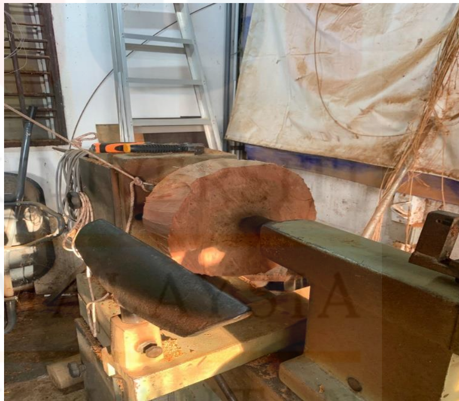
Gambar 9. Kayu Diletakkan Pada Mesin Larik