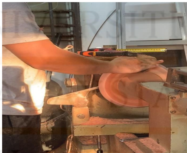
Gambar 13. Melicinkan Rebana Anak Menggunakan Kertas Pasir

Selain itu juga, selepas siap dilicinkan, badan rebana akan dibuat urat pada sekelilingnya. Teknik ini adalah pilihan sahaja, kerana ianya adalah sebagai perhiasan dan untuk menampakkan lagi kecantikan pada badan rebana anak. Pada zaman dahulu, proses ini tidak dibuat. Sekarang, proses ini ditambah bagi memenuhi permintaan pelanggan yang menginginkan kualiti tinggi dan corak yang menampakkan eksklusif. Urat turut dibuat dengan menggunakan peralatan pahat. Urat itu adalah seperti ukiran garisan bulat yang mengelilingi badan rebana anak. Pahat akan mengukir ukiran urat itu semasa badan rebana masih lagi berada pada atas mesin larik. Teknik ini memerlukan penelitian yang tinggi agar ukiran tersebut menjadi kemas dan tidak rosak. Ukiran urat ini akan dibuat pada bahagian depan dan juga pada bahagian belakang badan rebana anak.