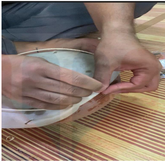
Gambar 21. Proses Pemakuan Rotan Bersama Kulit Kambing

Teknik yang seterusnya ialah dipanggil sebagai proses merambing. Teknik merambing adalah proses dimana rotan yang dibelah sebentar tadi, akan dijahit pada sekeliling badan rebana anak. Kulit kambing akan ditebuk lubang lalu dimasukkan rotan. Teknik ini memerlukan kesabaran dan penelitian yang tinggi supaya jahitan rotan pada badan rebana anak akan kelihatan kemas dan sekata. Sekiranya, rotan keras semasa proses jahitan dilakukan, ianya perlu dicelupkan kedalam air seketika sebelum sambung menjahitnya. Proses ini ditamatkan apabila rotan siap dijahit mengelilingi badan rebana anak. Setelah itu, badan rebana anak yang siap sepenuhnya, digosok dengan kertas pasir bagi mendapatkan tekstur yang licin dan bersih. Lalu rebana anak siap dikeringkan dan siap untuk digunakan.