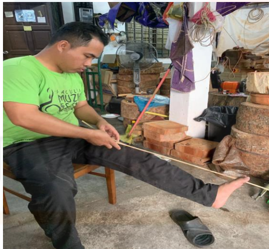
Gambar 17. Proses Membelah Rotan

Proses yang seterusnya membelah rotan untuk dijahit pada badan rebana anak. Rotan ini dibelah bagi mendapatkan saiz yang halus supaya senang untuk dijahit nanti. Setelah siap dibelah, rotan itu akan disamakan saiznya dengan memasukkannya ke dalam besi seperti yang ditunjukkan pada gambar di bawah. Setelah siap rotan digulung agar kualitasnya terjaga dan tidak mudah berbulu. Jenis rotan yang digunakan ialah rotan pulur.