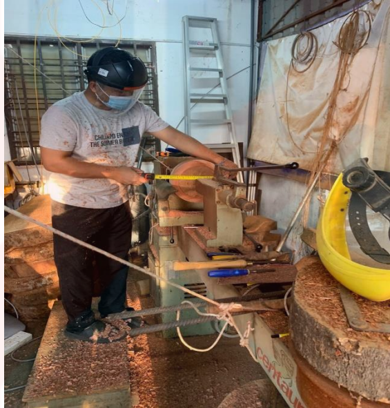
Gambar 11. Mengukur Saiz Badan Rebana Anak Sebelum Dipahat

memahat dilakukan, saiz badan rebana perlu ditengok dengan teliti supaya tidak terlebih dan terkurang. Maksudnya disini, kita mesti berhenti seketika untuk melihat sama ada saiznya itu betul atau tidak. Sekiranya kayu badan rebana masih besar, proses memahat diteruskan.