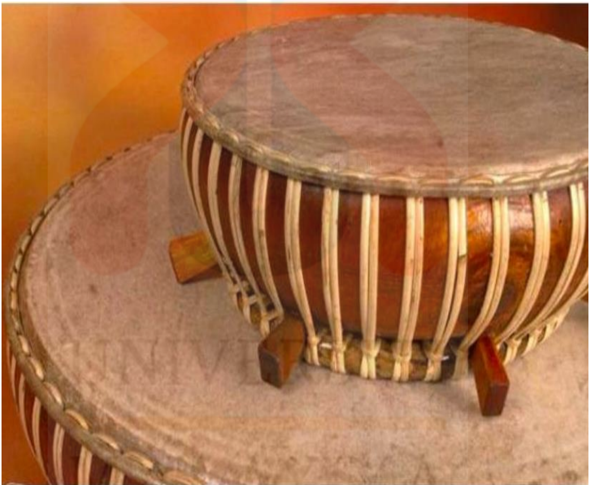
Gambar 5. Rebana Anak 12

rebana ini ialah, kulit haiwan seperti lembu atau kambing, kayu, tali dan paku. Rebana anak memerlukan teknik pembuatan yang teliti agar mendapatkan hasil yang kemas serta bunyi yang betul. Pengkaji akan mengkaji secara keseluruhan mengenai teknik pembuatan rebana anak yang terdapat di Tanjung Malim, Perak agar kajian mengenai Teknik pembuatan rebana anak ini adalah mengikut cara yang betul dan mudahnya. Pengkaji akan mengkaji dari awal kaedah pembuatan bermula sehingga ke kaedah terakhir pembuatan rebana anak di Tanjung Malim, Perak.