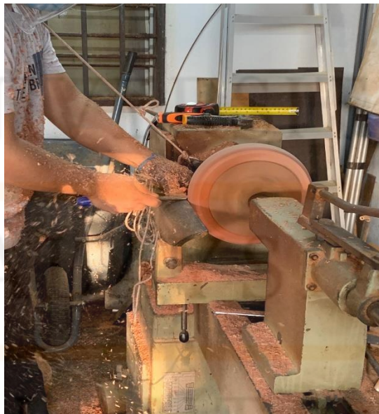
Gambar 12. Badan Rebana Anak Dipahat