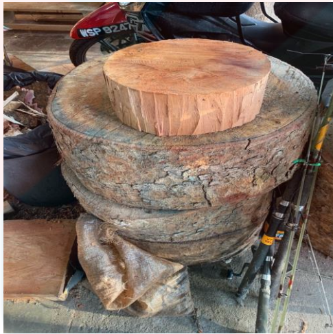
Gambar 7. Kayu yang telah Dikeringkan

Bahan utama didalam teknik pembuatan rebana anak adalah kayu. Kayu digunakan untuk membuat badan (body) atau juga disebut sebagai baluh rebana anak. Antara kayu yang boleh digunakan adalah seperti kayu tunjuk langit, kayu cengal, kayu nangka dan kayu jati. Kayu-kayu yang hendak digunakan mestilah bersifat keras dan tak mudah pecah. Hal ini demikian kerana, untuk memastikan supaya badan rebana itu bertahan lebih lama dan apabila kita melakukan proses pemakuan aksesori seperti rotan pada badan rebana, ianya tidak mudah pecah disebabkan oleh ketukan paku itu.