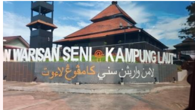
Gambar 1 : Merupakan tempat pembuatan alat muzik rebab

Lokasi kajian pengkaji tertumpu pada Kampung Laut yang terletak di dalam Daerah Tumpat, Kelantan. Kawasan ini terdapat beberapa tukang pembuat alat muzik yang terkenal. Sebagai contohnya ialah Encik Muhammad Khairul bin Sezali. Contohnya beliau telah berjaya sehingga peringkat antarabangsa dan memasuki pertandingan alat muzik tradisional di Kuala Lumpur dan Pahang. Hal ini kerana beliau memiliki kemahiran menukang dan juga memainkan alat muzik tradisional terutama rebab dan serunai.