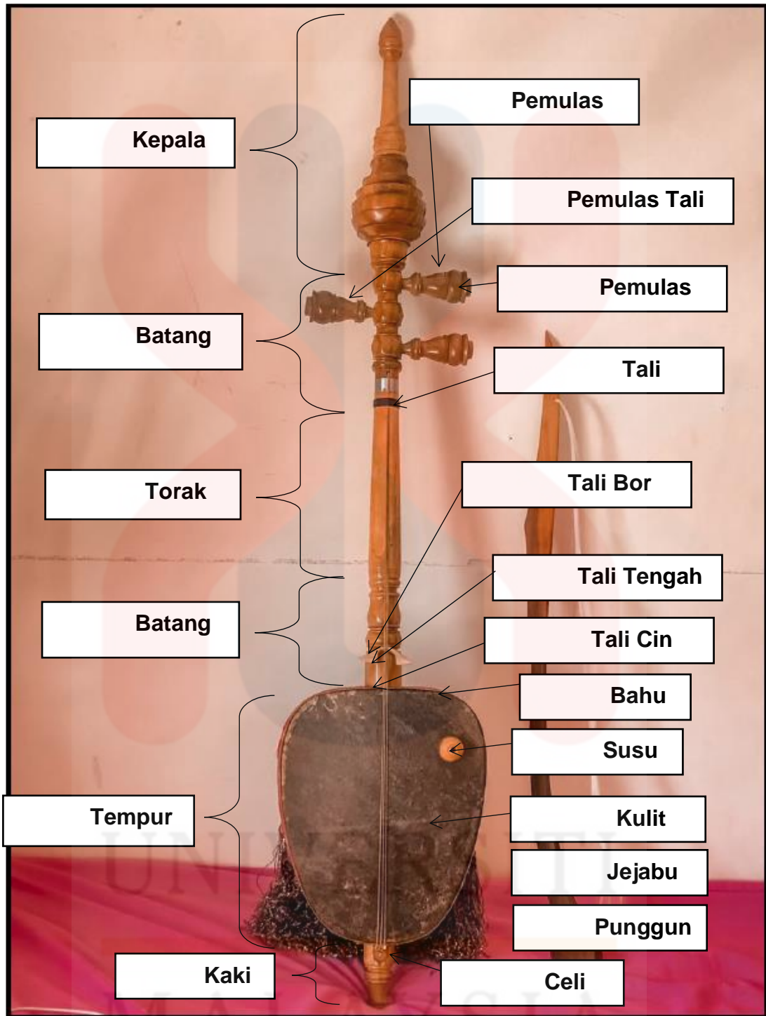
Gambar 3 : Rebab