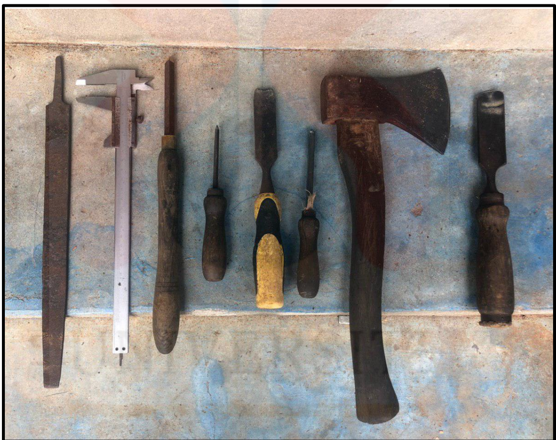
Gambar 4: Peralatan yang digunakan untuk membuat Rebab

Untuk menghasilkan rebab beberapa peralatan diperlukan. Gambar rajah di bawah menunjukkan beberapa peralatan yang digunakan antaranya mata kikir, caliper, pahat kikir mata tajam saiz besar, pahat kikir mata tajam saiz kecil, pahat mata sama, pahat kuku, kapak dan mata tikam rata. Setiap peralatan ini mempunyai fungsinya dan cirinya yang tersendiri. Oleh itu, pembuat rebab ini menggunakan alatan yang berikut untuk menghasilkan sebuah rebab yang berkualiti.