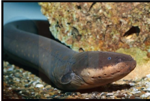
Gambar 1: Belut Laut ( Anguilliformes )