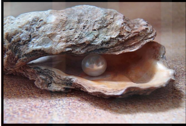
Gambar 3: Cengkerang Tiram ( Crassostrea )