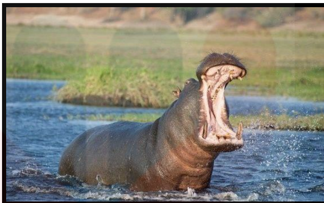
Gambar 2: Badak Air ( Hippopotamus Amphibius )