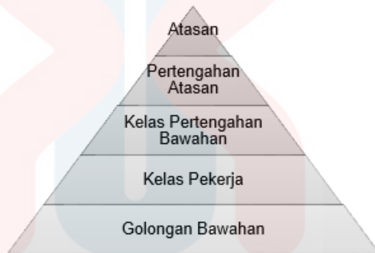
Rajah 2: Struktur Lapisan Kelas Sosial oleh Max Weber (1905)

Hal ini demikian, ahli-ahli sosiologi yang ada sehingga kini termasuklah tokoh sarjana sosiologi iaitu Max Weber (1905). Bersetuju bahawa, terdapat lima lapisan kelas sosial yang boleh dibezakan mengikut golongan kelas iaitu, golongan atasan, pertengahan atasan, pertengahan bawahan, pekerja dan bawah.