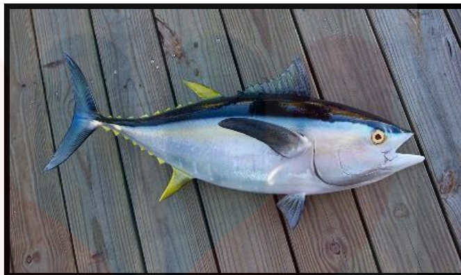
Gambar 4: Ikan Tuna ( Thunnus Sp )